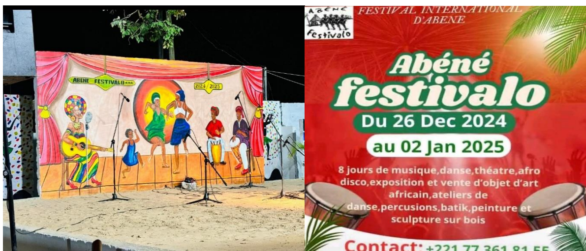
Figure 3 : Aperçu du festival d'Abéné ( Abéné festivalo ) et du programme édition 2024.

La localité d'Abéné est composée de plusieurs ethnies en majorité paysannes qui s'entrecroisent pour former une seule entité. Sa position géographique et sa diversité culturelle font d'elle une zone fréquentée par plusieurs touristes qui viennent de différents pays du monde entier. Dans l'optique de perpétuer et de mettre en valeur ces opportunités, la jeunesse organisée et unie d'Abéné dont l'objectif est de créer un parc de la culture Casamançaise, organise annuellement un festival de théâtre, de musique et de danse Africaine, afin de participer activement au développement socioculturel et économique de la région en général et de la localité en particulier. Il s'agit d'un programme riche répartie en huit jours ( figure 3 ).