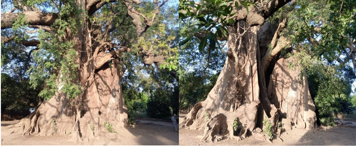
Figure 2 : Six fromagers sacrés « Banta woro » d'Abéné (Bocoum, décembre 2024).

Le bantang woro est l'un des atouts touristiques les plus importants de ce village (Bocoum, 2024). Dans ce village, on peut aussi visiter le site de « Bitini » qui est une mare où on peut voir des singes et des crocodiles. Les touristes peuvent faire des tours au village artisanale d'Abéné pour visiter et admirer la qualité des œuvres proposées et trouver des cadeaux et des souvenirs africains pour immortaliser le séjour. Des sculpteurs, peintres, couturiers, bijoutiers, etc., on trouve toutes les plus belles pièces rassemblées en un seul endroit. L'artisanat dépend du tourisme ; ce qui fait qu'il se développe plus pendant la haute saison et le festival lui donne plus de visibilité. En outre, différentes structures d'hébergement sont aménagées à partir des matériaux locaux offrent une qualité très appréciée par les touristes (Bocoum, 2024). Ces atouts font que différents types de tourisme sont praticables à Abéné, c'est à l'image du tourisme balnéaire, du tourisme culturel, de l'écotourisme, du tourisme intégré « chez l'habitant », du tourisme culturel, du tourisme de découverte, etc. D'après Bocoum et al. , (2024) les tourisme balnéaire et culturel, jouent un rôle important dans le développement local d'Abéné.