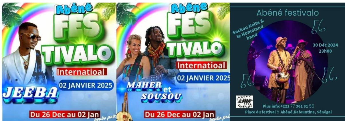
Figure 4 : Quelques artistes invités lors de l'édition 2024.

Ce festival permet de découvrir à travers le théâtre, la danse, le djembé et le son des tam-tams la Casamance au clair de lune. C'est un véritable rendez-vous de la culture en Casamance. Pendant toute une semaine de nombreux et variés spectacles de percussions africaines et de danses traditionnelles animent le village. De quoi passer des fêtes de fin d'année dans le tourbillonnement des traditions africaines et aux sons des djembés. Le village d'Abéné permet de célébrer la nouvelle année sous un festival coloré et plein d'entrain. Les groupes de musique traditionnelle des différentes ethnies à Abéné et de la région viennent s'y produire. Depuis quelques années des artistes connus à l'échelle nationale ou internationale s'y intéressent exemple : Jaliba Kouyaté, Baba Maal, Maher et Sousou, Séckou Keita, etc ( figure 4 ).