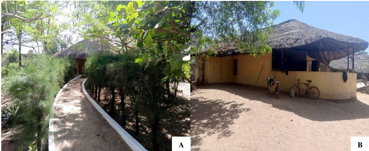
Figure 6 : Campements d'Abéné (A. Le Kossey ; B. Maison Sounjata) au style traditionnel (Bocoum, Décembre 2024).

du bâti local ( figure 6 ). Ils allient parfois style traditionnel à moderne. Ils permettent d'accueillir les touristes en leur offrant un confort et une découverte culturelle.