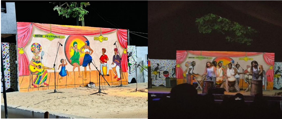
Figure 5 : Abéné festivalo aux rythmes des tam-tams édition 2024 (Bocoum, décembre 2024)

En outre, pour les activités sportives, il y a un tournoi de football des équipes locales, des séances de lutte et des marathons. Ces activités sportives sont animées par les prestations de troupes traditionnelles. Selon un athlète venu de la League d'athlétisme de Ziguinchor, « c'est la troisième fois que nous participons au festival d'Abéné pour le marathon. C'est une occasion qui nous permet de nous tester avant d'entrer en piste. J'ai aimé le festival, je trouve que c'est une bonne idée, nous voyons qu'il y a beaucoup de folklore qui nous rappelle nos cultures. Cela peut inciter les populations à bien conserver leurs cultures et profiter de ses occasions pour montrer leurs savoirs-faires. » (Entretien, Bocoum décembre 2024). De même, des conférences et des forums sont aussi organisés avec des thèmes qui varient d'une édition à une autre. Ce sont des moments de débats et d'échanges entre population, les intellectuelles de la région, des acteurs du tourisme et les touristes. À ces activités, nous pouvons ajouter l'exposition de produits artisanaux grâce aux stands mis à la disposition des artistes-peintres, sculpteurs ou encore de services de restauration par l'équipe organisatrice, des visites de sites touristiques. La diversité de ces activités permet d'avoir des impacts sur le développement local.