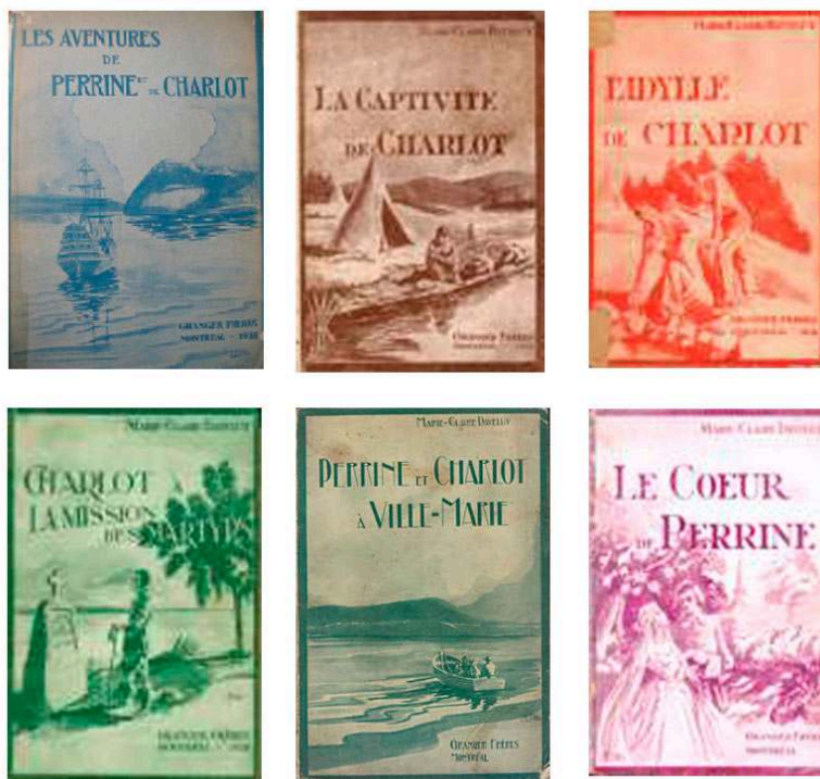
Ill. 5. (mosaïque) : Les Aventures de Perrine et de Charlot (2e éd., rev. Montréal, Librairie Granger frères limitée, 1938) ; La Captivité de Charlot (Montréal, Librairie Granger, 1938), Charlot à la « Mission des martyres » (Montréal, Librairie Granger frères limitée, 1938), L'Idylle de Charlot (Montréal, Librairie Granger frères limitée, 1938), Perrine et Charlot à Ville-Marie (Montréal, Librairie Granger frères limitée, 1940), et Le Cœur de Perrine (Montréal, Librairie Granger frères limitée, 1940).