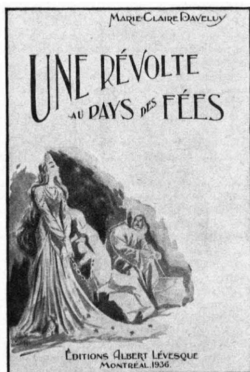
Ill. 4. Une Révolte aux pays des fées publiés en 1936 chez Albert Lévesque. Sources : Marie-Louise d'Auteuil, « Une révolte au pays des fées », OB , novembre 1936, p. 68.

BAnQ (archives numérisées) © Bibliothèque et Archives nationales du Québec