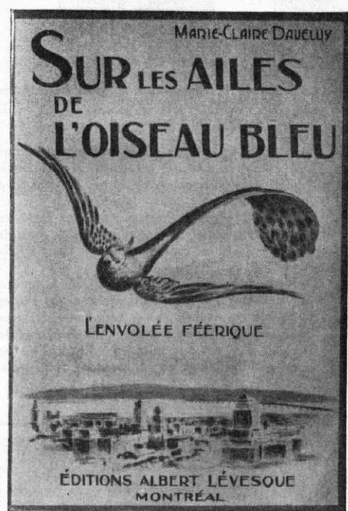
Ill. 3. Couvertures de Sur les ailes de l'oiseau bleu Sources : Alphonse de La Rochelle, « Sur les ailes de l'oiseau bleu », OB , mars 1936, p. 200.

BAnQ (archives numérisées) © Bibliothèque et Archives nationales du Québec