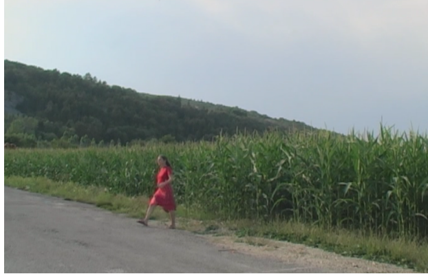
Figure 10 : Clip 38 du stimulus Trajectoire (038_Path_F_walk_outof_field_sideRL)