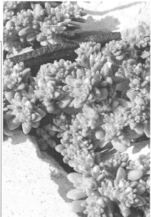
Photo 1 : Sedum litoreum , Photo Daniel Pavon, avril 2004, Marseille (13), au Mont Rose