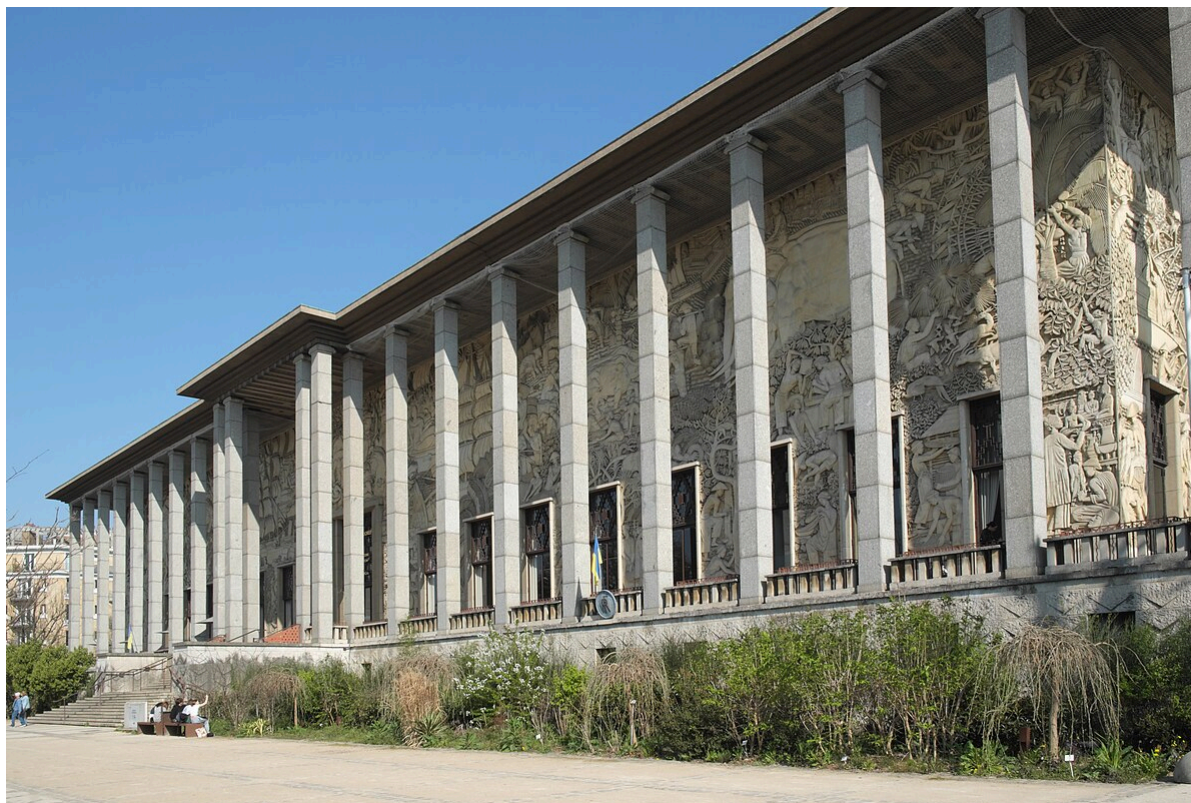
Le Musée de l'histoire de l'immigration, au Palais de la Porte Dorée, à Paris.