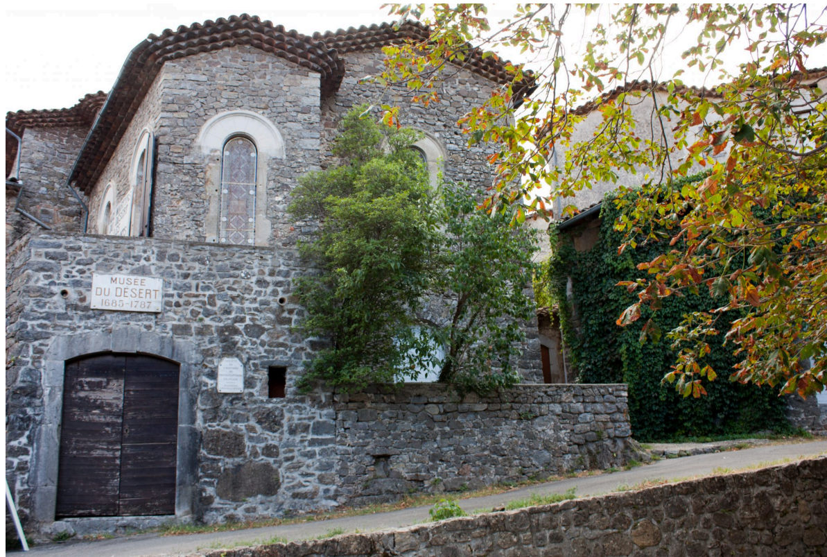
Le Musée du Désert, situé dans les Cévennes, retrace l'histoire de la minorité protestante en France.

Dans l'ouvrage de Pierre Nora, il n'y a rien non plus sur la question des usages sociaux, des rapports des populations et des individus ordinaires à ces lieux de mémoire. C'est d'ailleurs sur ces deux questions, l'absence des usages sociaux de ces lieux de mémoire et celle des minorités, de l'histoire coloniale et de l'histoire de l'immigration, qu'a porté l'une des principales critiques formulées, à l'époque, à l'encontre du projet des « lieux de mémoire », par l'historienne Lucette Valensi dans un article publié en 1995 (5). Cette dernière y évoque l'idée qu'il faudrait faire une seconde enquête du point de vue de la population, réaliser des entretiens