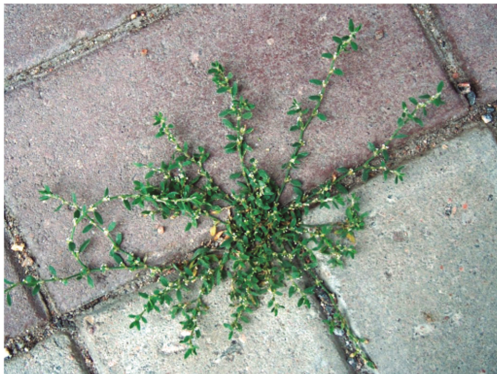
Fig. 1. « Renouée des oiseaux » ( herbula proserpinaca ).