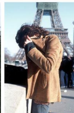
Roses And Guns , 1995-2016