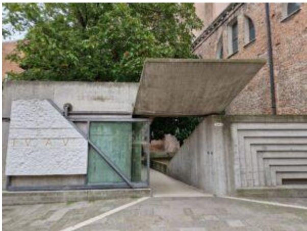
Entrée de l'IUAV

Arrivées la veille, nous étions dès 9h dans la cour de « Tolentini », le bâtiment principal de l'Università Iuav, construit à l'entrée du couvent des Tolentini, à proximité de l' église San Nicola da Tolentino au nord de Venise. Le complexe Tolentini, rénové entre 1960 et 1965, est le siège de l'université. Il abrite également la faculté d'architecture et la bibliothèque. Réalisée en 1985 par Sergio Los , l'entrée ouvrant sur un petit jardin est inspirée des nombreux croquis de Carlo Scarpa .