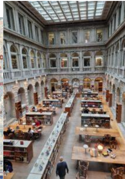
Salle de lecture de la Marciana moderne