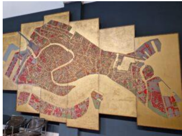
Plan de Venise exposé dans la salle Colona. En rouge, les bâtiments construits après 1945.

L'IUAV (Istituto Universitario di Architettura di Venezia) est l'une des trois universités de Venise. Fondée en 1926, elle est à l'origine une école d'architecture – comme son nom l'indique (Institut universitaire d'architecture de Venise) mais propose désormais des formations variées dans des domaines tels que la mode, le design industriel, les arts visuels, le théâtre ou encore la conservation du patrimoine. L'école historique de l'urbanisme et de l'aménagement du territoire , parmi les premières en Italie, a été inaugurée en 1970, bien que les enseignements de l'urbanisme soient parmi les premiers en Europe dès le milieu des années 1930. Elle dispose de trois départements :