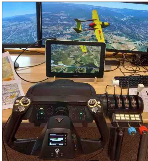
Figure 7. Équipement matériel du poste de pilotage.