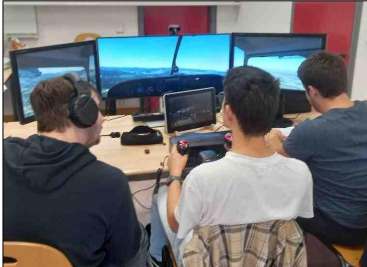
Figure 5. Poste d'équipage.