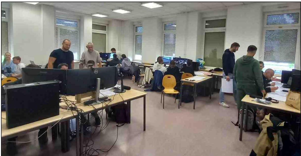
Figure 3. Groupe TP en simulation de vol

environnement flou et mouvant de contraintes fixé uniquement en fin de parcours. Plutôt que de nous imposer ces limites dans le moule initialement imaginé, au risque de perdre toute cohérence, nous avons préféré adapter au mieux notre contenu didactique à la richesse de l'environnement disponible tout en respectant les valeurs et objectifs fondateurs du projet. Le corolaire négatif de cette adaptation tardive des contenus est qu'il ne nous a pas été possible de tester l'ensemble du dispositif avant de le proposer aux étudiants. Heureusement, grâce à nos expériences pédagogiques précédentes, aux pilotages de mini-projets (notamment la mise en place de Situations d'Apprentissage et d'Évaluation ou SAE dans le nouveau BUT), à la connaissance du public visé, au soutien des intervenants extérieurs et, surtout, à une attitude honnête et humble face aux étudiants, nous avons pu proposer une première version cohérente et opérationnelle du module à toute la promotion de 3 e année (Figure 3).