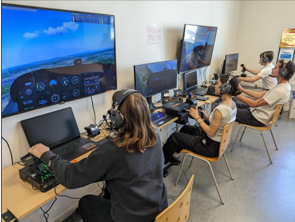
Figure 1. Plateforme FlighTeam de l'IAE Paris-Est.

FlighTeam a été répliquée avec le simulateur X-Plane 4 à l'IUT de Colmar (Université Haute Alsace). La suite de cet article rend compte de ce projet.