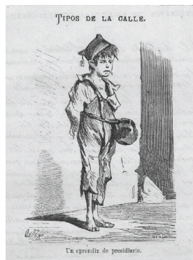
Ilustración 3. FRANCISCO ORTEGO, «Tipos de la calle», grabado sacado de Los Niños , 1870, © Biblioteca Nacional de España, Madrid.

ambos sexos que, sucios, enfermizos, harapientos, se dedican a la vagancia, a la mendicidad» por las calles de Madrid. Según él, esos seres que «hormiguean en el seno de la sociedad» yerran «en perspectiva de la cárcel, si no ya del presidio o del cadalso» 39 . Por este artículo, y por los muchos cuentos que relatan los trágicos destinos de niños traviesos, entendemos que, mientras el buen chico se cría en el recinto de la familia, de la escuela, luego de la universidad, hasta alcanzar puestos socialmente valorados, los espacios ineluctables de la infancia traviesa son la cárcel, las galeras, o el cadalso, como sugiere con peculiar elocuencia el grabado sacado de Los Niños (1870) que retrata a un niño harapiento, descalzo, en la calle, calificado por la leyenda de: «aprendiz de presidiario» [Ilustración 3].