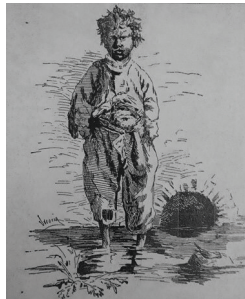
Ilustración 5. Urrutia, «El niño desaplicado», grabado sacado de La Ilustración de los niños , 1878, © Biblioteca Nacional de España, Madrid.

Ved, apreciables lectores, las tristes consecuencias de la desaplicación y de la holgazanería. Escarmentad vosotros en cabeza ajena, con el ejemplo de Miguel, y os conquistaréis el aprecio de cuantos os rodeen 71 .