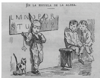
Ilustración 1. FRANCISCO ORTEGO, «En la escuela de la aldea», grabado sacado de Los Niños , 1870, © Biblioteca Nacional de España, Madrid.

Como consecuencia de este desarraigo afectivo, observamos en las publicaciones estudiadas un desarraigo topográfico, físico, una marginación o exilio del niño fuera de los espacios de crecimiento y de socialización que le corresponden. Como señala Ricardo Fernández Romero, el escenario de la nueva consideración del niño en el siglo 19 será, en primer lugar, la «casa», transformada en «hogar», un espacio cerrado y protegido de la calle, y después, como derivación del primero, la «escuela» 31 , que irá construyendo un «molde», un camino de socialización al que se tendrá que adaptar el niño 32 . Cabe destacar que los niños traviesos, en muchas publicaciones, aparecen marginados en el seno mismo de estos nuevos mundos infantiles, como lo es el chico malo de la escuela dibujado por Francisco Ortego en un número de 1870 de Los Niños [Ilustración 1], que lleva orejas de burro y se encuentra castigado, de pie, aislado de sus compañeros sentados en un banco. Al pie del grabado, el comentarista lo designa como un chico «más malo que la quina», no tonto, pero «tan holgazán que nunca sabe la lección», avergonzado por el maestro «con esas tremendas orejas» 33 .