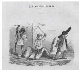
Ilustración 4. Francisco ORTEGO, «Los chicos pobres», grabado sacado de Los Niños , 1870, © Biblioteca Nacional de España, Madrid.

parental en el dibujo, podemos inferir una forma de animalización de esos niños pobres 48 , presentados como muy ajenos al mundo del joven lector. A esta nueva pobreza, que el grabado pinta, se asocia finalmente la noción de «peligro social», que delata el miedo por parte de las clases pudientes a la delincuencia juvenil, desarrollada según los reformadores sociales en «unos tipos de familias desestructuradas y disfuncionales» 49 . Tener una infancia mala, vagabunda, callejera, se ubica dentro del espectro de la delincuencia, de la conflictividad y de la disolución social.