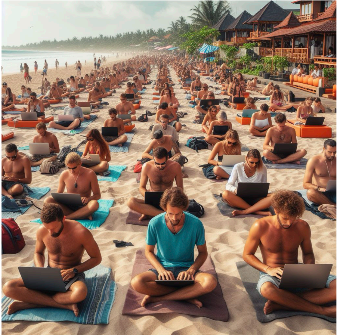
Figure 1 : Crédits : Clément Marinos via Image Creator from Designer