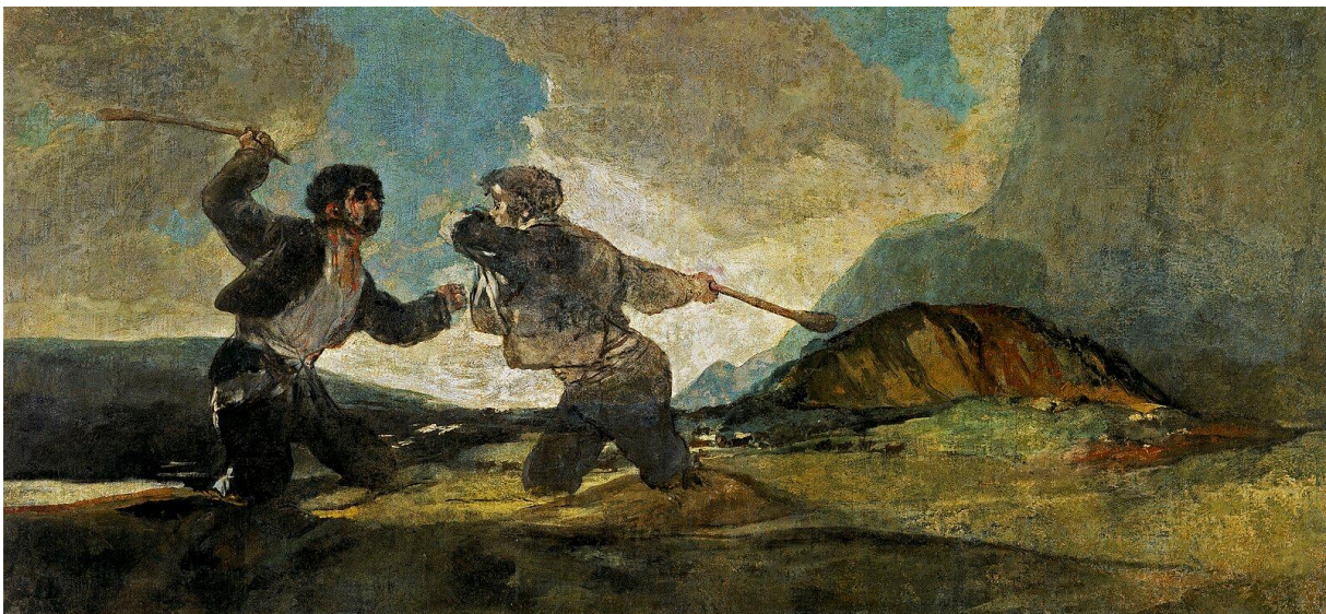
Francisco de Goya y Lucientes, Duelo a garrotazos (1820-1823)

En 1990, le philosophe français Michel Serres publie un essai intitulé Le Contrat naturel , dont l'objet est de promouvoir la reconnaissance de la nature en tant qu'interlocuteur capital dans le règlement des rapports politiques et sociaux. L'ouvrage est parmi les premiers à esquisser l'image d'une planète agitée de soubresauts, réanimée sous l'effet de l'action humaine 6 : « la Terre tremble [...] elle se transforme de notre fait. Nous inquiétons la terre et la faisons trembler ! [...] la Terre s'émeut ! » (135-136). Outre cette exclamation aux accents galiléens (parallèle que Serres établit lui-même dans le texte), l'essai s'ouvre sur l'évocation d'un tableau de Francisco de Goya intitulé Duelo a garrotazos , dans lequel deux hommes sont représentés en train de s'affronter à coup de bâtons, enfoncés jusqu'aux genoux dans un sol manifestement meuble auquel ils ne prêtent pas attention.