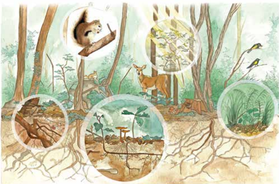
↑ Figure 1. Zoom sur quelques interactions clés au sein de l'écosystème forestier (illustration Thérèse Danieau).

Cependant, il serait inexact de dire que la compétition pour les ressources souterraines, comme l'eau ou les éléments minéraux, a moins d'importance dans la structuration de l'écosystème. Il faut reconnaître que cette question a été beaucoup moins étudiée, notamment