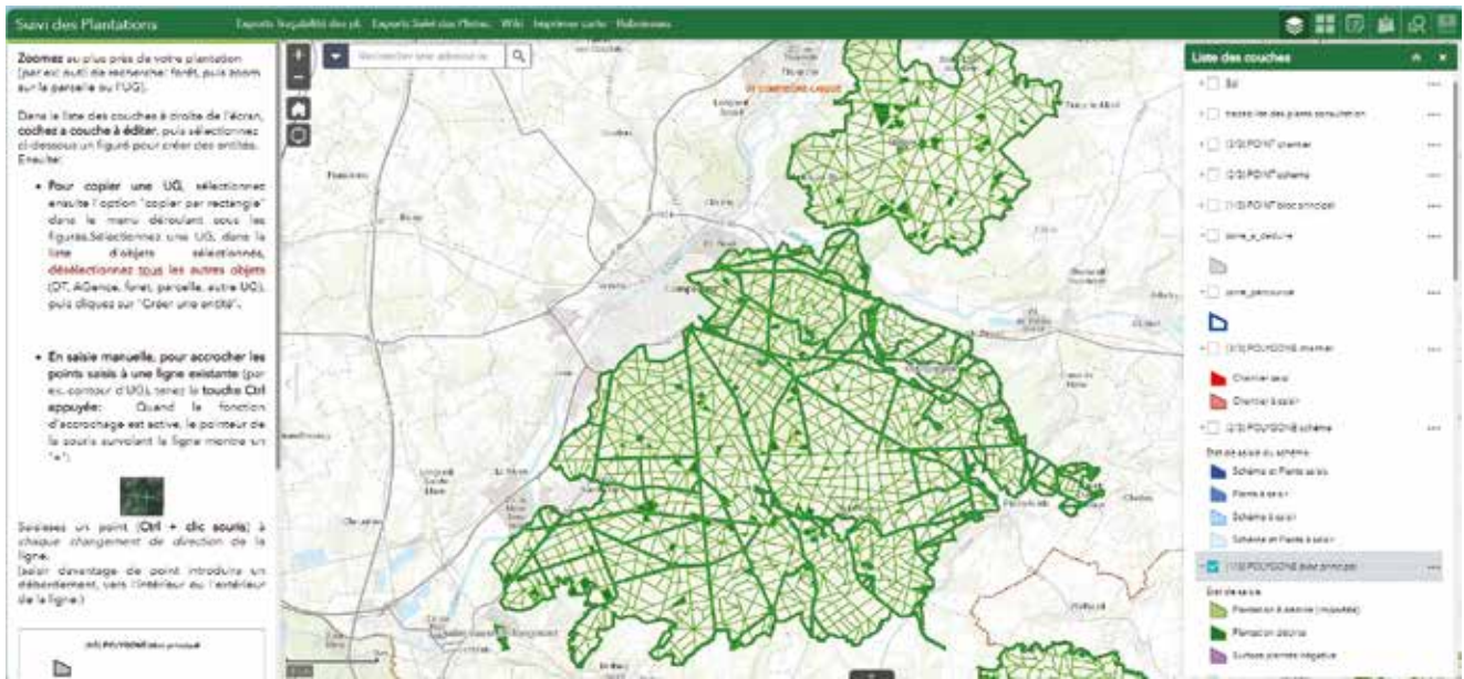
↑ Figure 1. Copie d'écran de la Webcarto "suivi des plantations"

Les dispositifs de financement France 2030 et le Fonds pérenne permettront de financer des travaux d'amélioration de la régénération naturelle dans les peuplements dépréciés ou vulnérables aux effets du changement climatique. Ces travaux seront aussi à rentrer dans la Webcarto « suivi des plantations » ?