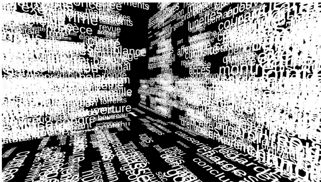
Société i Matériel, iREAL, Monde 4 AIIICE, 2019 © Marc Veyrat

sieurs réseaux, sur plusieurs eSPACES 15 puisque l'œuvre en réseau se trouve toujours confrontée à une distorsion spatiale et temporelle. Entre l'espace-temps physique des utilisateurs et l'espace-temps du programme et des réseaux. Donc ce nouveau territoire qui se dessine est un lieu hybride. L'« eSPACE » iREAL que nous articulons est @CONSTITUÉ désormais d'espaces virtuels ET iRÉELS, associés à des temporalités – des mesures d'ordres – superposées. Mais qui dirige quoi ? iREAL nous interroge ainsi soudainement sur la pertinence d'un éventuel maître du JE(U)... À ce propos, une Intelligence Artificielle, également en cours de développement avec le laboratoire CiTu - Paragraphe (Université Paris 8), propose à la personne qui pose les cartes sur le Plateau de JE(U) de se @VOIR à travers un portrait alphanumérique... en quelque sorte un « toto » in/visible 16 .