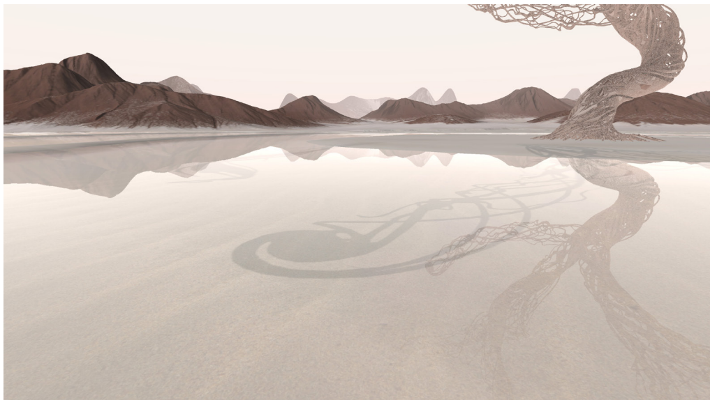
Société i Matériel, iREAL, Monde ZERØ , 2019 © Marc Veyrat

iREAL 7 est une œuvre d'art hypermédia XR qui @-MIXE des environnements en VR déclenchés à l'aide de cartes posées sur un plateau de JE(U). Quatre mondes fonctionnent actuellement : ils sont tous traités esthétiquement de manière originale pour proposer différentes expériences d'immersion. Le Monde ZERØ 8 est totalement désertique. Seul un arbre mort trône sur la scène, au centre d'un lac gelé, recelant quelques mots pris dans la glace et disposés en spirale... Le Monde 1 9 nous entraîne dans un simulateur LIDAR alors que le Monde 2 10 nous permet de déambuler dans une ville mémoire à l'instar de l'installation d'Alberto Burri « Il Cretto di Burri » à Gibellina. Enfin le Monde 4 ALICE 11 , nous plonge dans l'obscurité d'un labyrinthe qui se @-CONSTITUE,