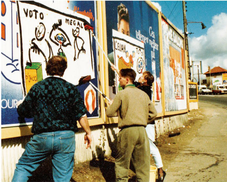
Élection municipale, Blois, 1989.