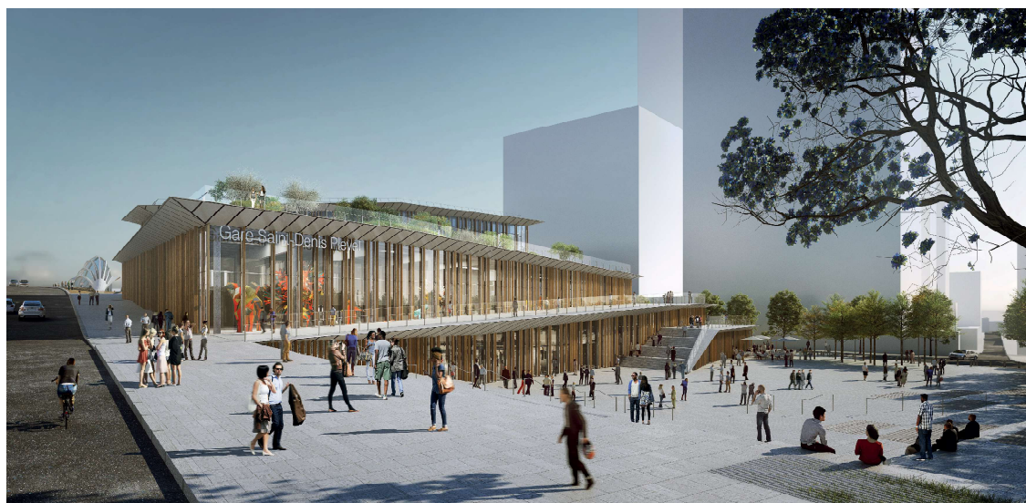
2 e 3 - Prospettive della stazione di Saint-Denis-Pleyel. Copyright Kengo Kuma & Associates, Société du Grand Paris.

stazione GPE non è stato descritto in maniera molto dettagliata dai media francesi e stranieri. La rivista GA Document, pubblicata a Tokyo, utilizza la presentazione del progetto che appare sul sito web di Kengo Kuma 21 e la stampa francese, a sua volta, si serve degli stessi elementi linguistici per descrivere il progetto. Diversi articoli evidenziano il design della stazione olimpica di Parigi che ricorda gli origami. Sebbene ne sia spesso sottolineata l'originalità, è interessante notare che il riferimento agli origami sembra ricorrere frequentemente nei progetti di Kuma, come nel caso della ristrutturazione del Museo Albert-Kahn a Boulogne-Billancourt 22