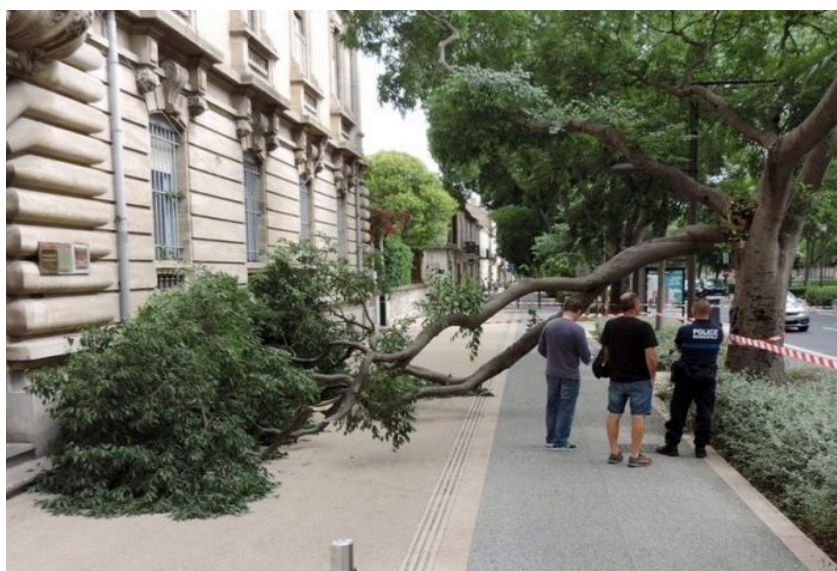
Fig. 1 : Rupture « estivale » d'une branche de micoucoulier. Nimes, juin 2018

L'objectif de ce travail de thèse, démarrée en novembre 2019, est d'explorer le comportement mécanique des branches soumises au vent. Il vise en particulier à étudier leur dimensionnement, résultat des croissances primaire et secondaire, en regard des sollicitations mécaniques qu'elles subissent quotidiennement et à comprendre les phénomènes de ruptures qui semblent intervenir lors d'évènements climatiques particuliers. Si à ce stade du projet, le choix des espèces testées n'a pas été fixé, il serait envisageable de travailler sur des résineux et des feuillus, a minima pour comparer les comportements de ces deux grand types de plans ligneux et leurs contraintes.