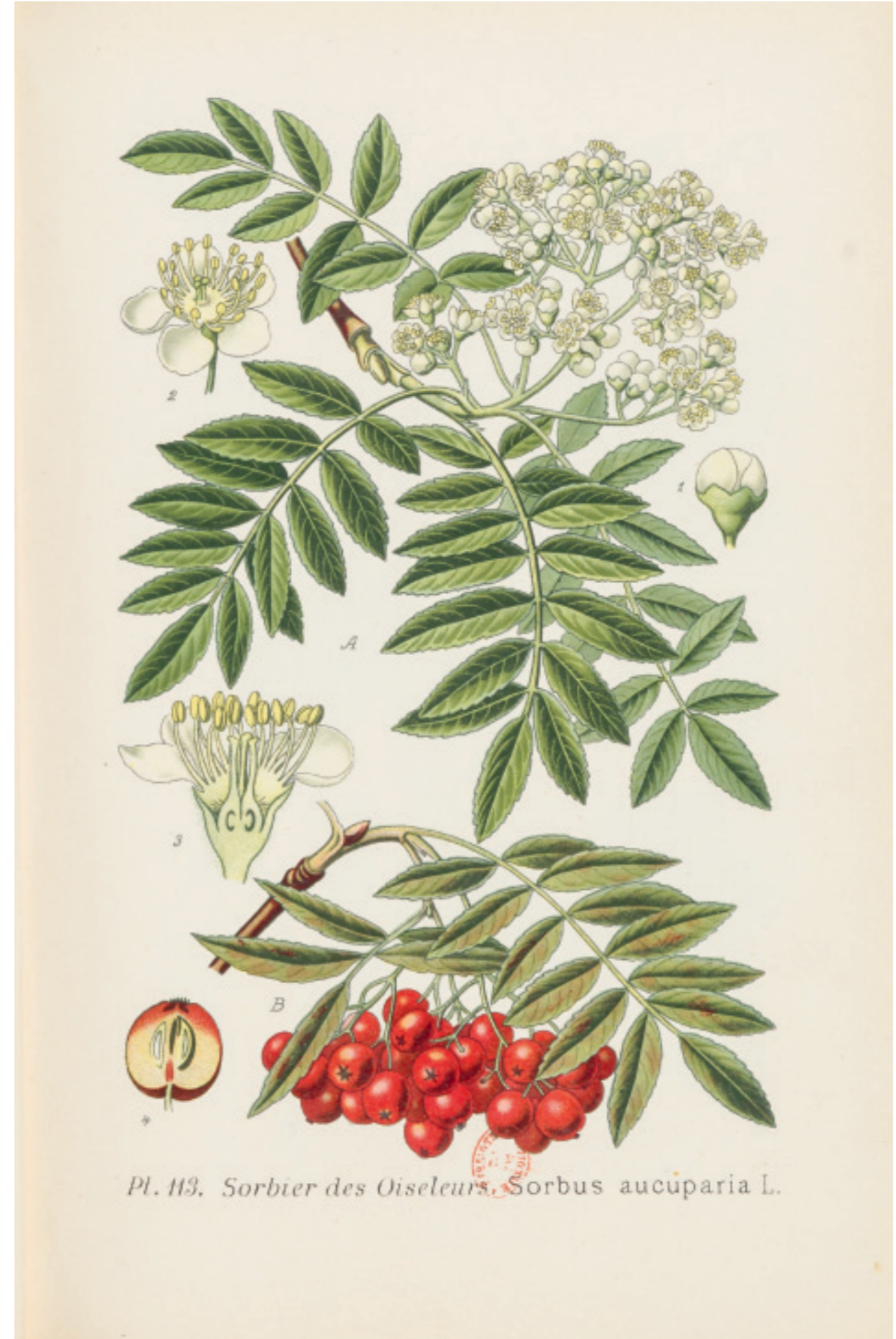
Sorbier des oiseleurs, in A. Masclef, Atlas des plantes de France utiles, nuisibles et ornementales: 400 planches coloriées... et un texte explicatif des propriétés des plantes, de leurs usages et applications... tome 2, Paris, P. Klincksieck, 1891. Bibliothèque nationale de France, département Sciences et techniques, 8-S-7451 (2).

29 . Séminaire de Chemillier, EHESS, 2 mars 2011.