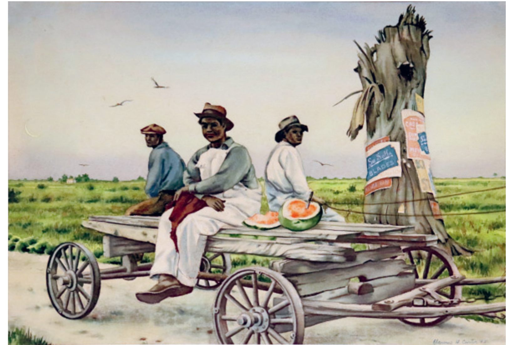
Clarence Holbrook Carter, Tidewater , 1945. Collection du Southern Ohio Museum and Cultural Center, Portsmouth, Ohio.