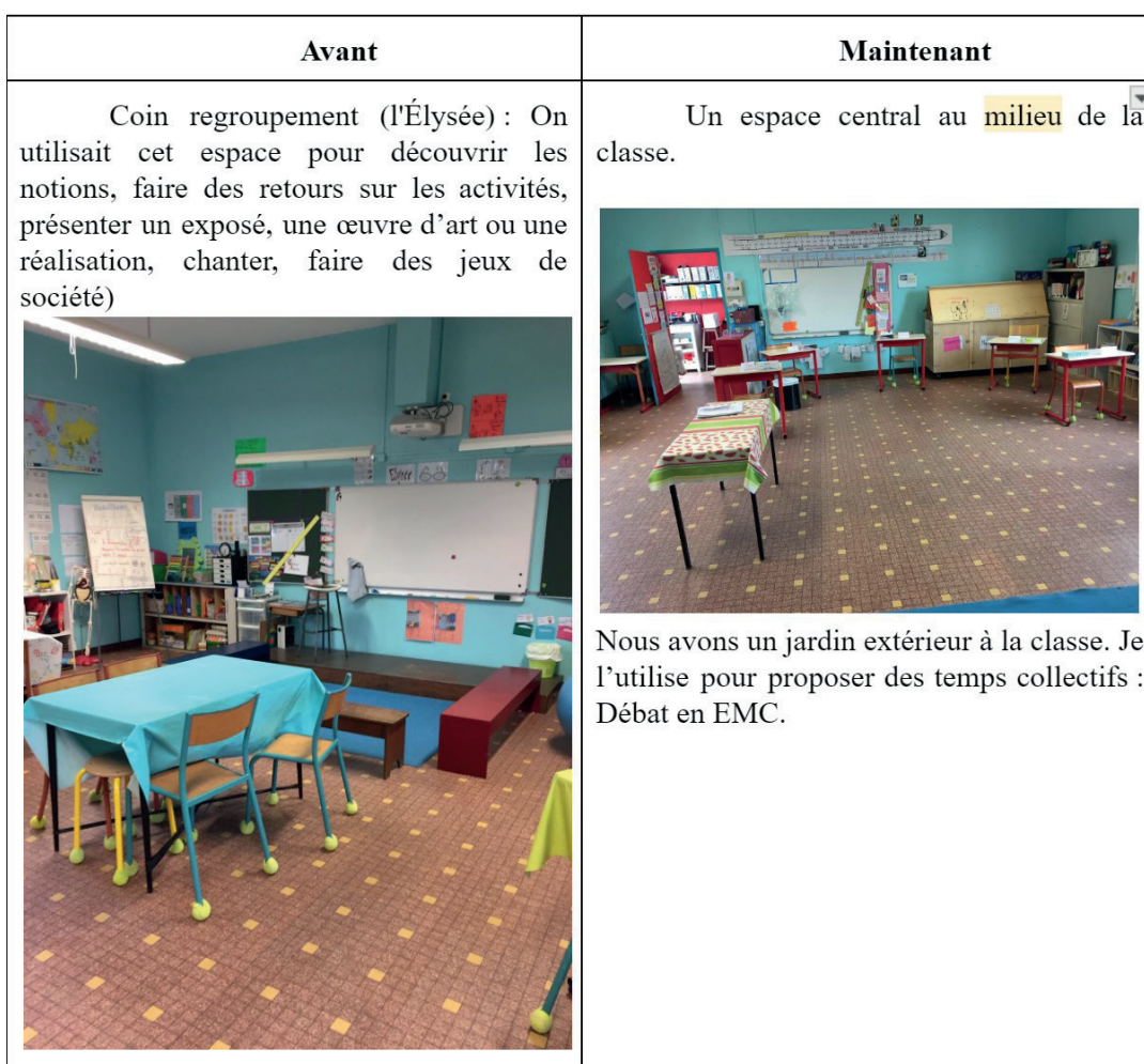
Fig. 1 - Extrait 1 du cahier journal de E1 : l'aménagement de la salle de classe, ©Marie-Adeline Moitié

Le cahier journal numérique s'est avéré être un outil précieux dans ces études de recherche, offrant plusieurs points positifs significatifs. Tout d'abord, il a joué un rôle essentiel dans le maintien du lien avec les terrains d'étude malgré les restrictions de déplacement et de présence physique imposées par les différents protocoles sanitaires en vigueur dans les établissements scolaires (Mercier et Lefer Sauvage, 2022). Grâce à cet outil numérique, il a été possible de suivre l'activité des enseignants à distance, ce qui a permis de collecter des données pertinentes et de continuer à nourrir les recherches malgré les circonstances exceptionnelles. Le cahier journal d'E1 apporte des éléments concrets sur le climat de classe et sur sa pratique (parfois illustrée par des photographies