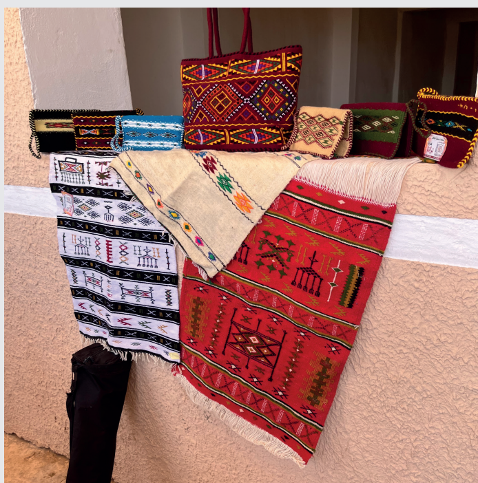
Accessoires « tendance » tissés à la main à Ghardaïa

magasins de vaisselle et de vêtements pour femmes et enfants. D'autres femmes se consacrent à la confection de petits accessoires féminins « tendance » tels que des pochettes de téléphone, des sacs et des étuis à lunettes, qui connaissent un succès rapide sur le marché local. D'autres encore se sont lancées dans des productions innovantes comme des produits cosmétiques et des huiles essentielles.