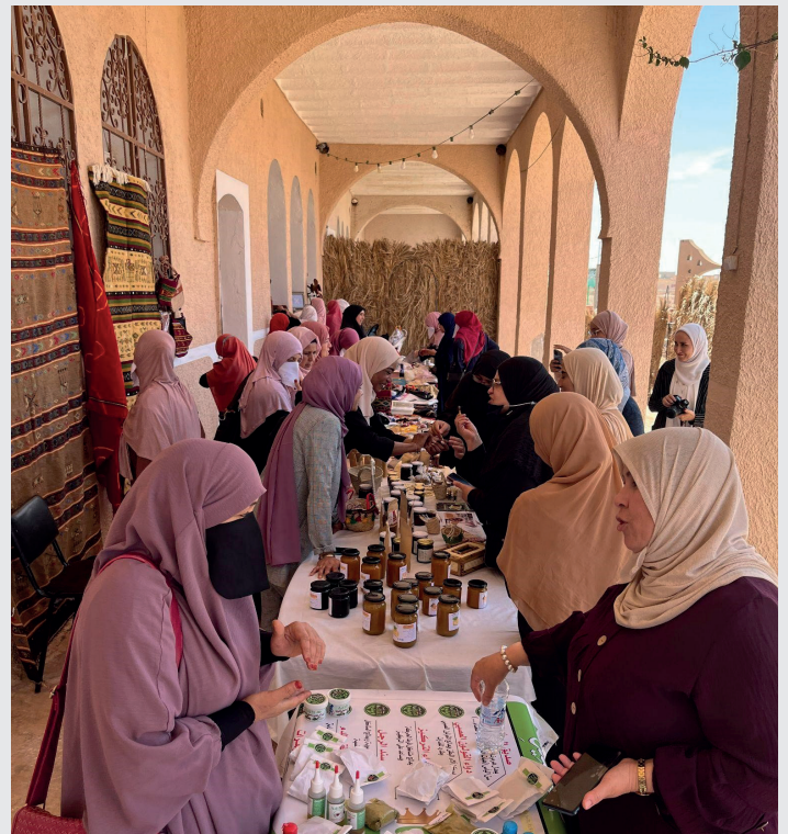
Vente de produits préparés par des femmes entrepreneurs à Ghardaïa