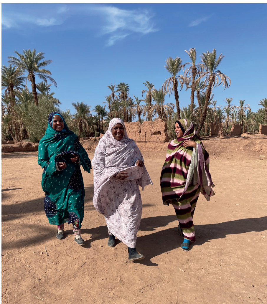
Trois femmes de l'oasis de Ternata dans la vallée du Drâa