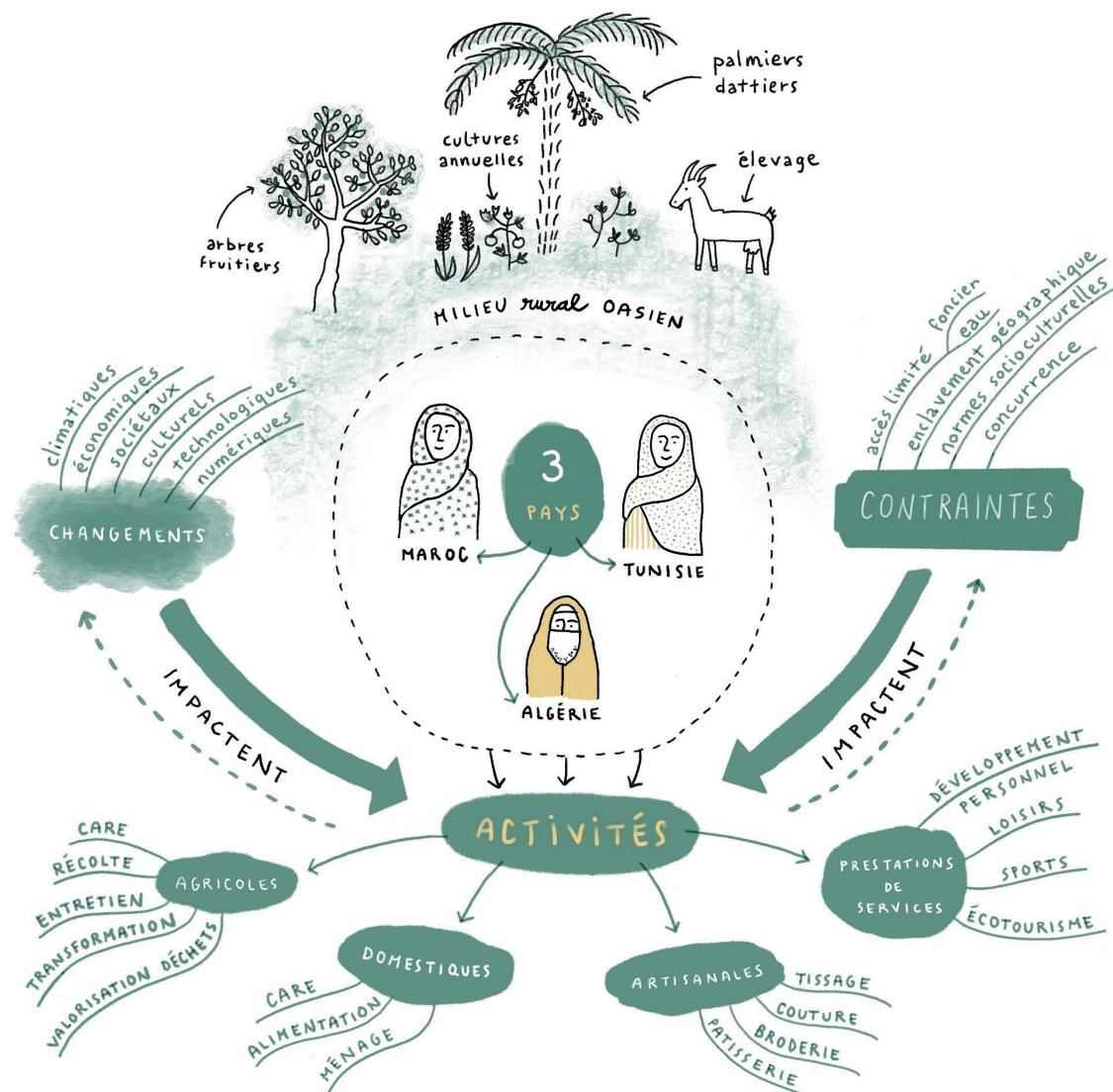
Activités initiées par les femmes dans un contexte oasien contraignant et changeant