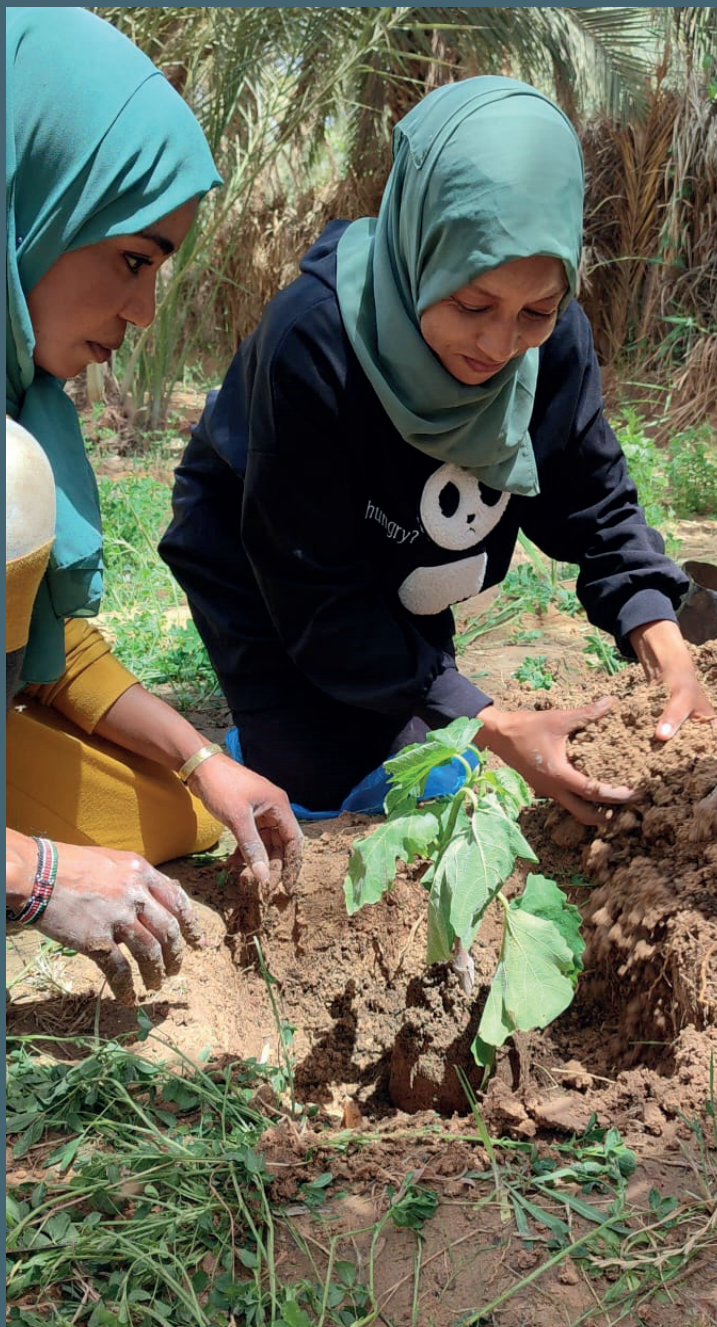
Activité agricole en Tunisie

Pour conclure nous proposons les recommandations suivantes afin d'appuyer ces femmes et leur contribution au développement des oasis :