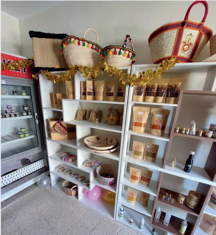
Boutique de produits de beauté tenue par une femme de la vallée du Drâa

La SMSA fournit aussi un cadre juridique qui permet aux adhérentes de bénéficier d'emplois formels, d'encadrement et de formations. La SMSA permet également aux adhérentes d'accéder plus facilement à des financements auprès des banques et des instituts de microfinance.