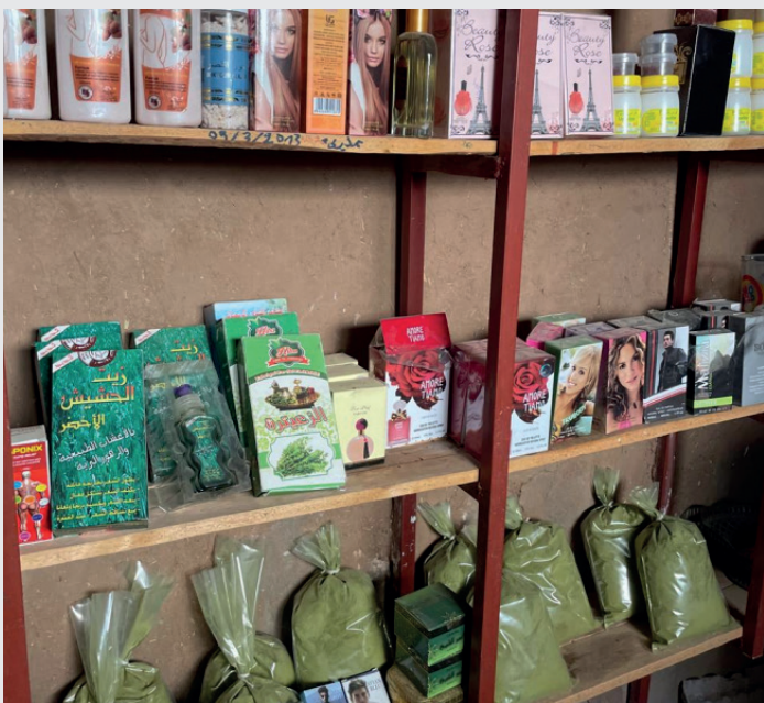
Boutique de produits de beauté tenue par une femme de la vallée du Drâa

Selon les différents contextes oasiens, certaines des initiatives décrites ci-dessus sont soutenues par des acteurs du développement ou des initiatives privées, tandis que d'autres ne le sont pas et reposent principalement sur la volonté et la contribution des femmes qui les lancent.