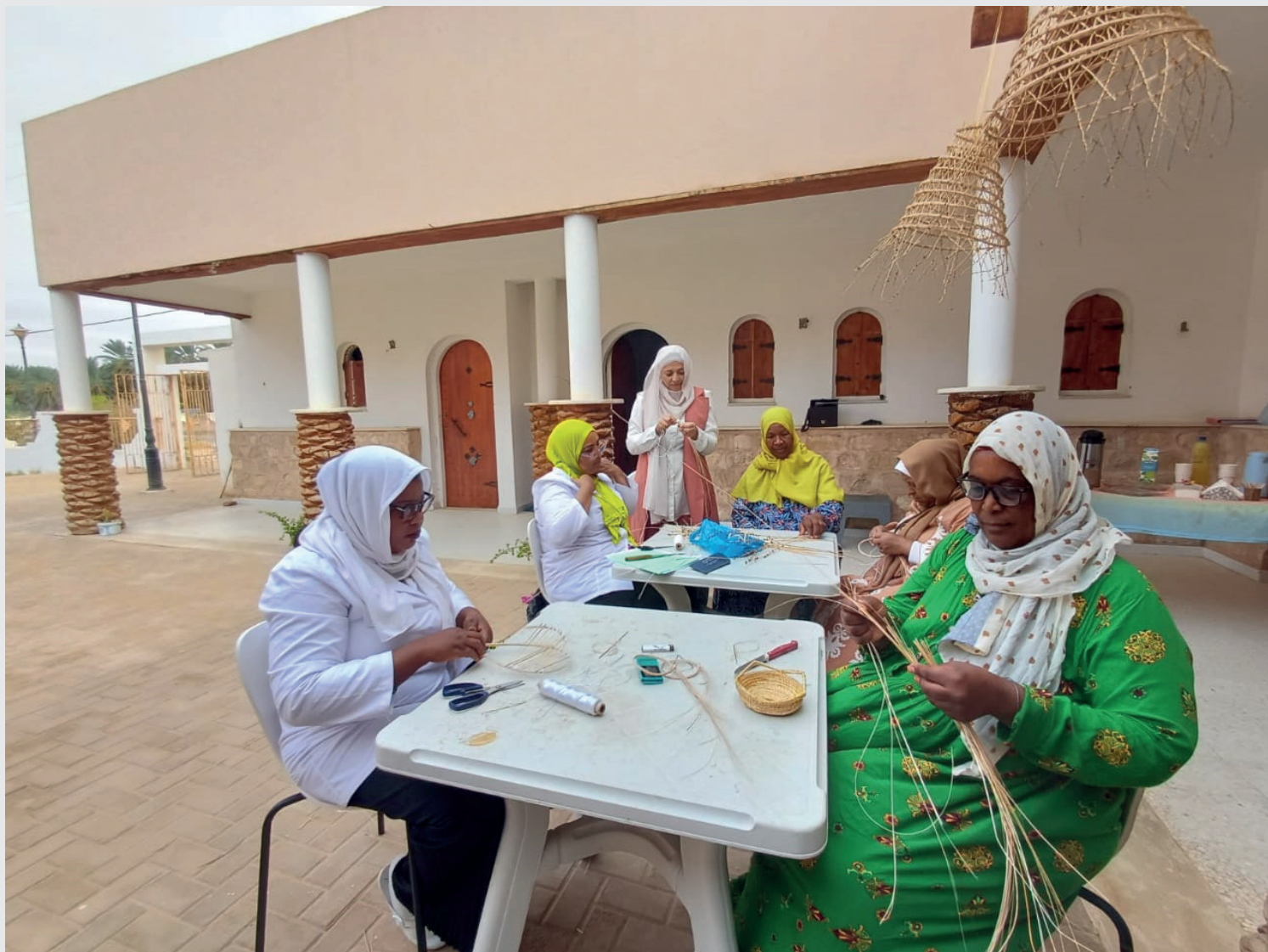
Production d'artisanat en Tunisie