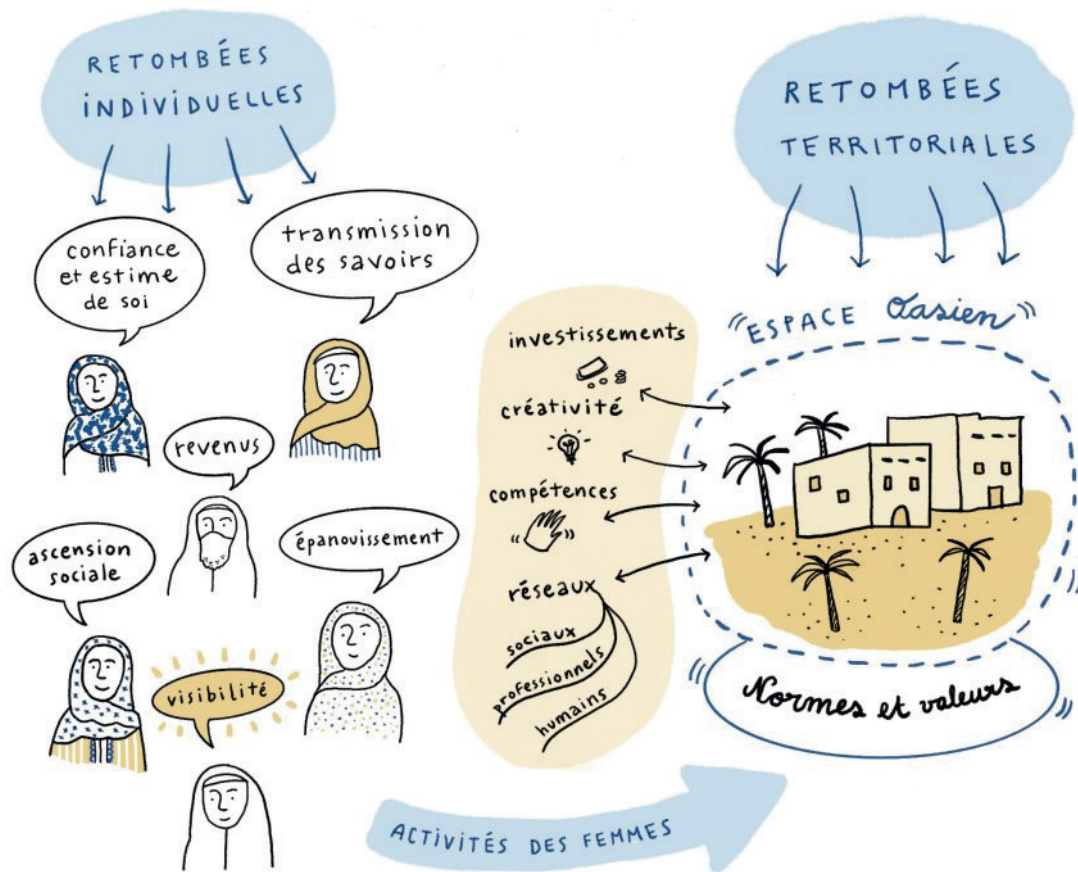
Les retombées individuelles et territoriales des activités des femmes oasiennes