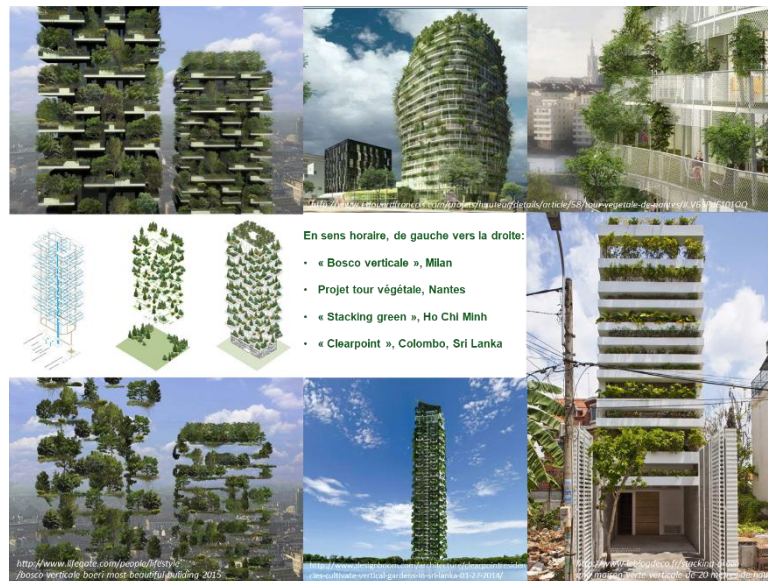
Figure 2 : Quatre exemples de Tours vertes

En premier lieu, dans ce cadre réglementaire et au-delà des matériaux utilisés, les nouvelles constructions se doivent d'afficher une image esthétique d'une ville-nature en offrant un cadre de vie faiblement énergivore, au risque d'un universalisme architectural et urbain. Ce processus est illustré par l'émergence des Tours vertes dans la plupart des villes mondiales (Figure 2).