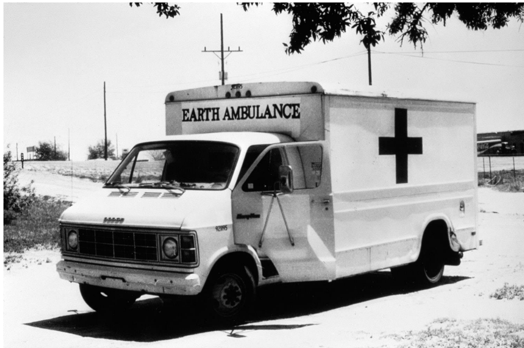
Figure 4 : Helène Aylon, Earth Ambulance , 1982. Photographie noir et blanc, 27,94 x 21,59 cm.