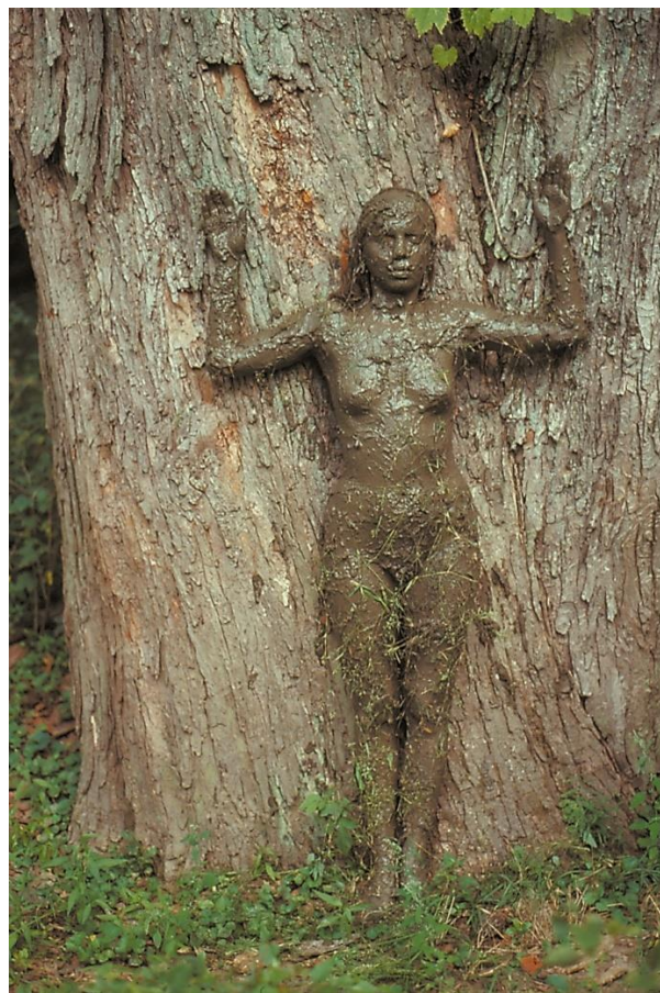
Figure 3 : Ana Mendieta, Tree of Life , 1976. Photographie couleur, 20 x 25,5 cm.

Ces rituels de communion avec la nature ont certes partie liée avec l'histoire personnelle de l'artiste - celle d'un déracinement et d'une quête identitaire qui explique ce désir profond de remonter aux origines 13 -, mais ils prennent aussi une dimension plus universelle dans la mesure où ils ravivent la croyance primitive d'une « force féminine omniprésente » dans la nature. Influencée au début des années 1970 par les études de l'ethnologue Lydia Cabrera sur la culture afro-cubaine, Ana Mendieta avait très tôt engagé son travail de performance dans une démarche ritualistique évoquant le culte de