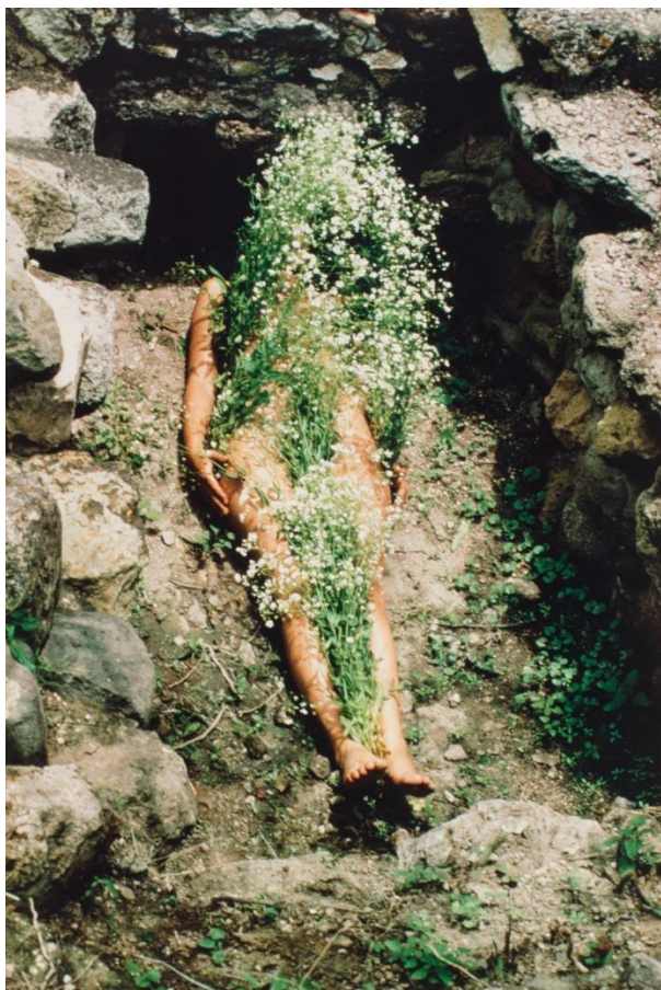
Figure 2 : Ana Mendieta, Imagen de Yagul , 1973. Photographie couleur, 50,8 x 33,97 cm.