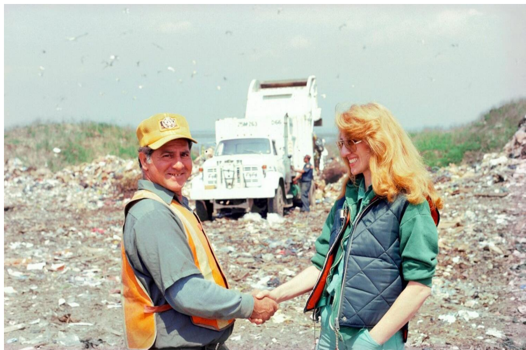
Figure 5 : Mierle Laderman Ukeles, Touch Sanitation, 1978-1980. Performance: "Handshake and Thanking Ritual", 1979-1980. Photographie couleur.