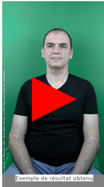
Exemple de résultat obtenu

$SPPAS/.sppaspyenv~/bin/python $SPPAS/sppas/bin/cuedspeech.py -l fra -I i --createvideo=true --handtrans=4 --handangle=1 --handpos=1 --handsset=d