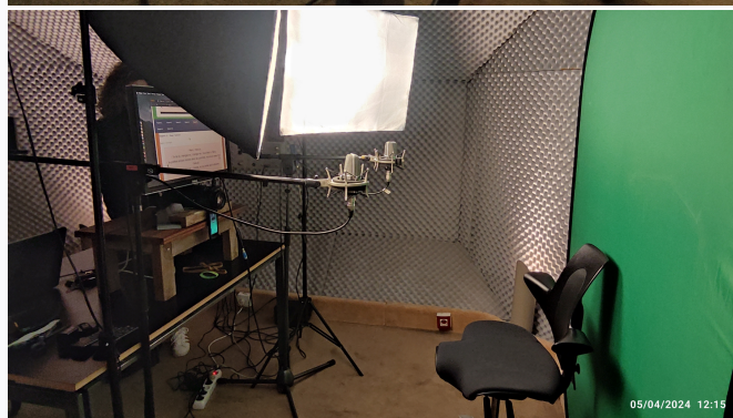
Conditions des enregistrements