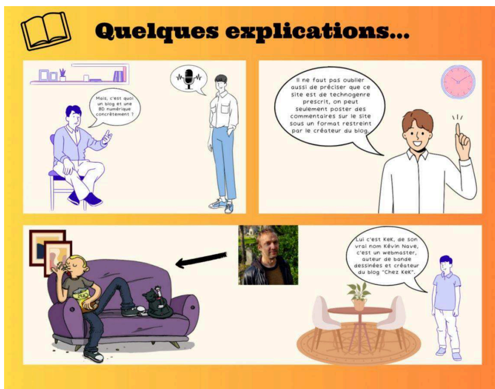
Figure 4. Extrait du scénario pédagogique autour de la BD numérique.