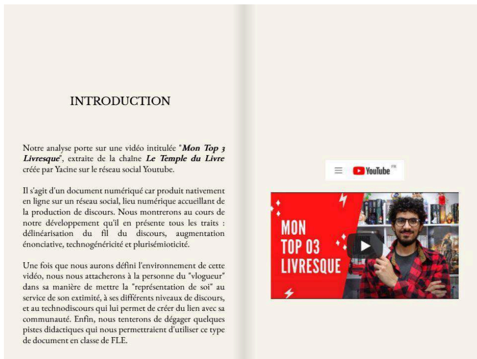
Figure 5. Exemple de l'analyse d'un BookTube Top produite dans un Book Creator.