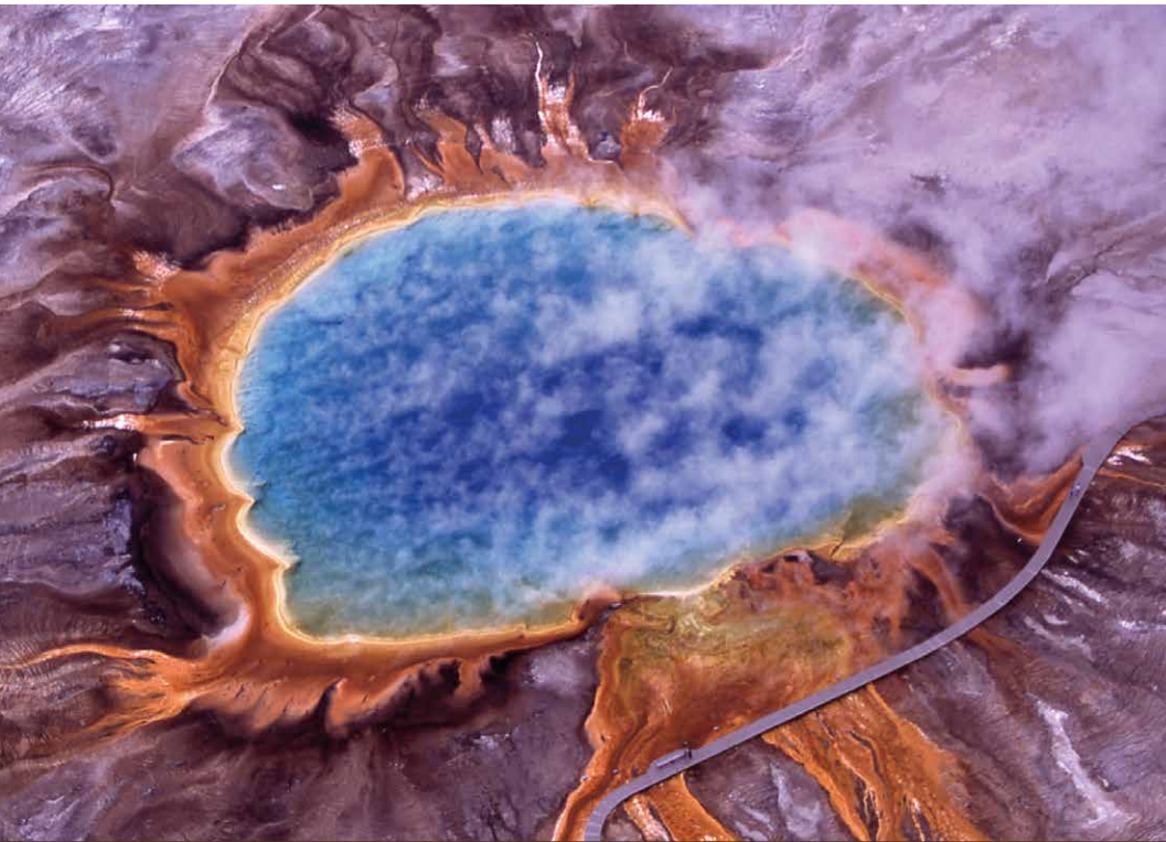
Le Grand Prismatic Spring , bassin d'environ 75 sur 91 mètres d'eau chauffée à plus de 70 °C. Au centre, l'eau est stérile et, sur le pourtour, s'étend un immense tapis d'algues, de bactéries et d'archées. Ces conditions dantesques furent peut-être le bain quotidien de LUCA et ses comparses (parc national de Yellowstone, États-Unis).

propose quelque 4,28 milliards d'années en arrière, et on s'approche des plus anciennes formes de vie fossilisées retrouvées à ce jour. C'est très tôt, dans l'histoire de la planète. Cela voudrait dire que la prolifération du vivant a été bien plus rapide qu'on ne le croit, rendant probable l'existence d'autres formes de vie (présentes ou passées)... ailleurs. Chouette!