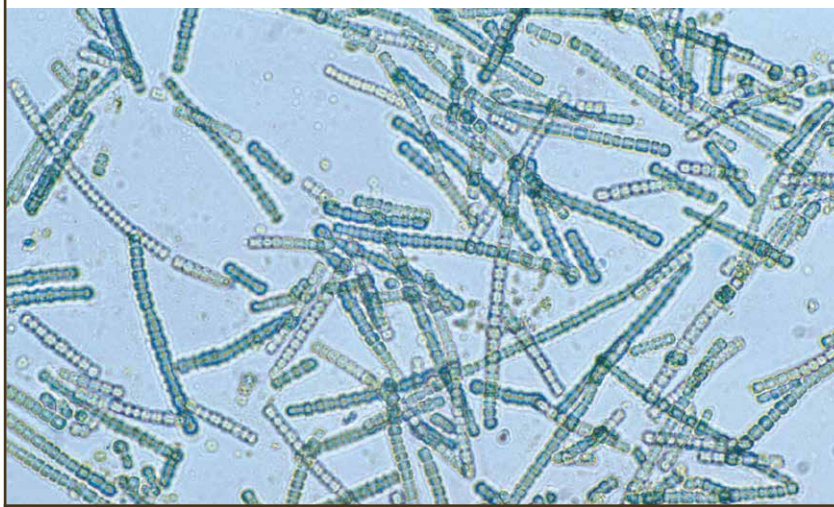
Cyanobactéries, un portrait de LUCA? (cliché W. van Aken/CSIRO/CC).

On peut rembobiner le fil pour chaque haplogroupe, c'est-à-dire pour chaque groupe d'humains ayant un même ancêtre commun en lignée patrilinéaire ou matrilineaire. En France, par exemple, l'haplogroupe Y majoritaire s'appelle R1b (R-M343) et on pourrait traquer le dernier garçon en filiation patrilinéaire exclusive de ce groupe, appelons-le "Jean-Michel Y-R1b chromosomique".