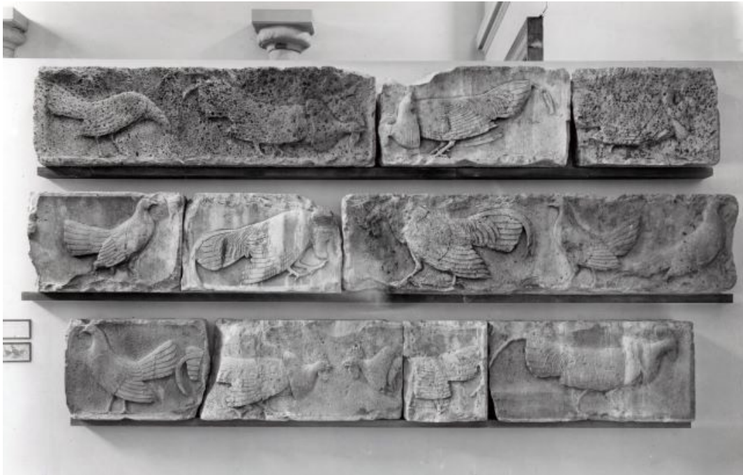
Fig. 12 Parte di un fregio di un monumento funerario, galli e galline, Xanthos, circa 480 a.C. British Museum, 1848,1020.13.