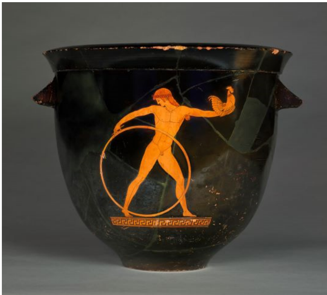
Fig. 7 Cratere con Ganimede, cerchio ginnico e gallo, pittore di Berlino, Atene, circa 500-490 a.C., Musée du Louvre, G175.