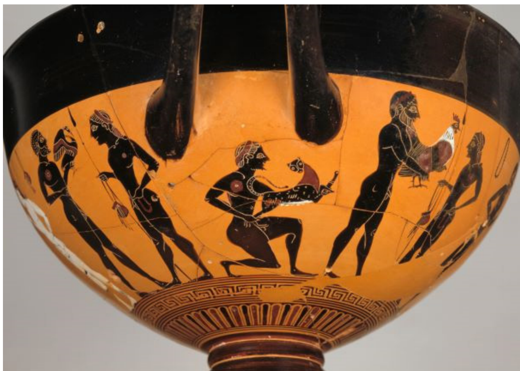
Fig. 17 Skyphos del pittore di Amasis: un gallo offerto a un efebo, Atene, circa 540 a.C. Musée du Louvre, A479.