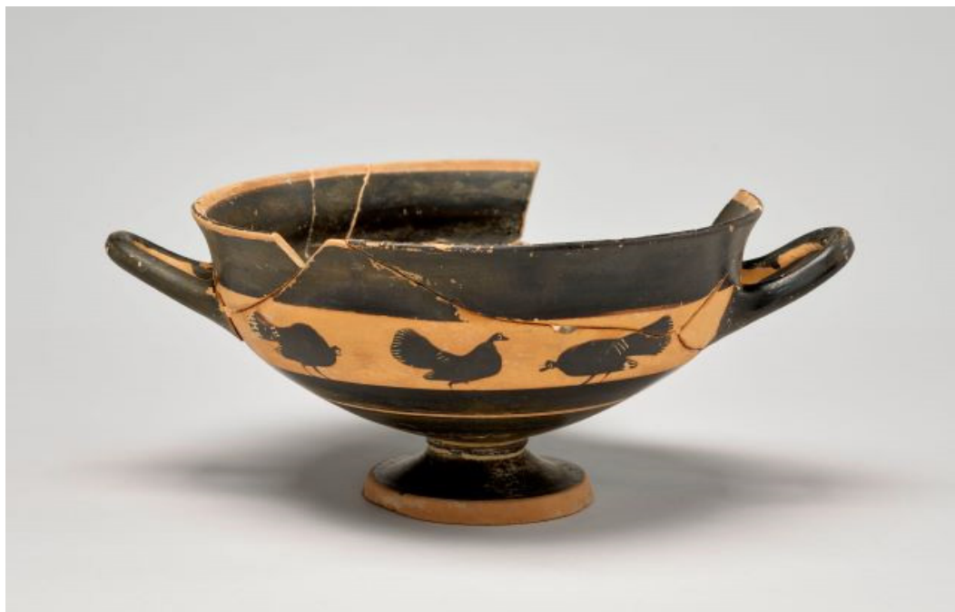
Fig. 11 Coppa dei piccoli maestri, con galli e galline, Atene, circa 550-525 a.C., Musée du Louvre, Elé36.