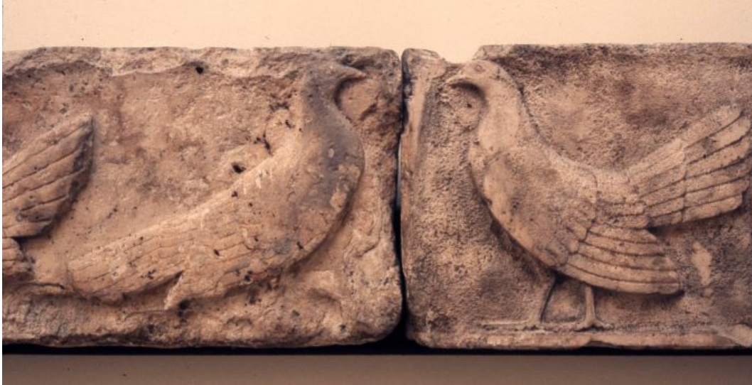
Fig. 13 Dettaglio di un monumento funerario, galline, Xanthos, circa 480 a.C. British Museum, 1848,1020.16.