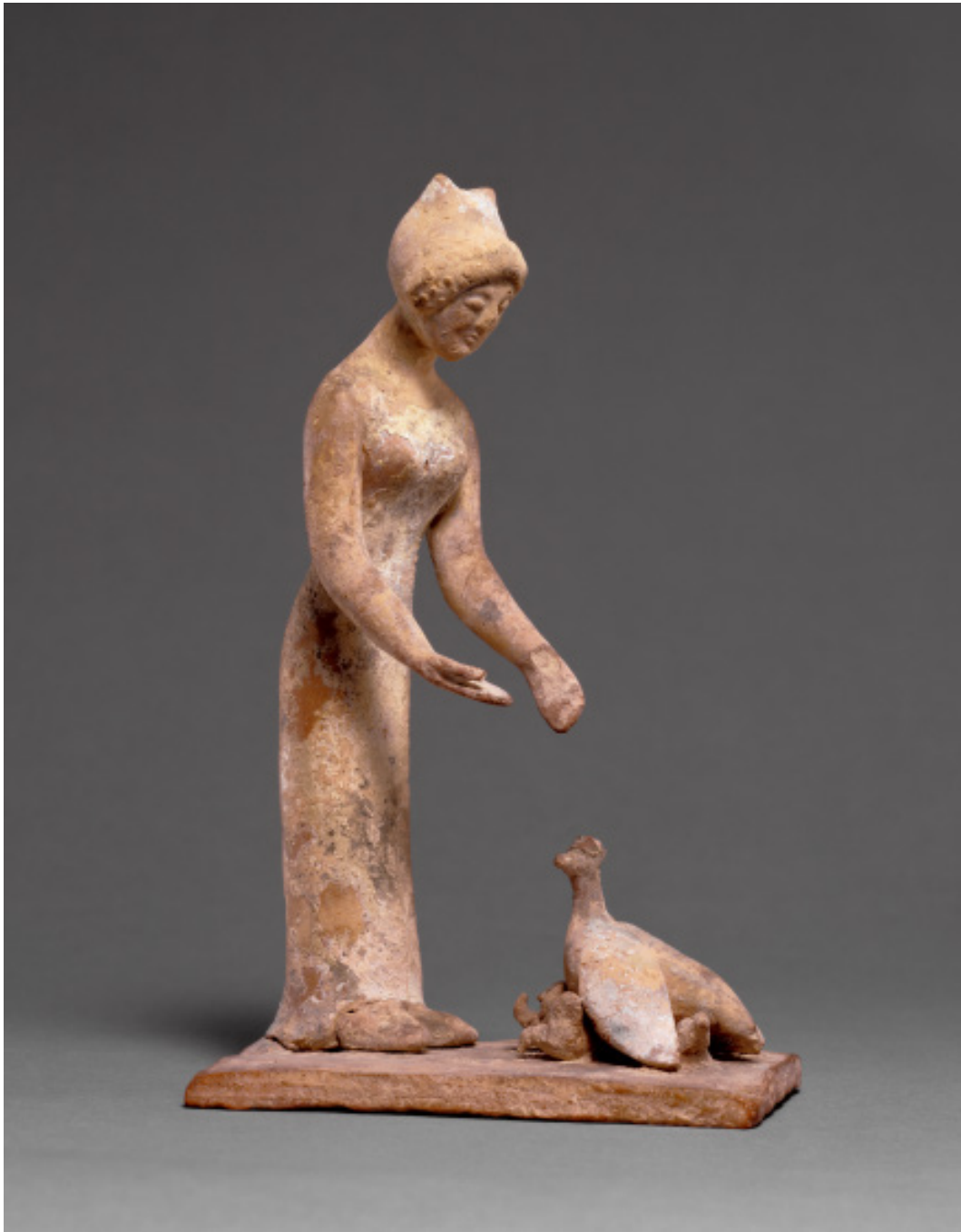
Fig. 10 Statuetta di una donna che nutre una gallina e i suoi pulcini, Beozia, circa 500-475 a.C. The J. Paul Getty Museum, Villa Collection, Malibu, California, Gift of Barbara and Lawrence Fleischman, n° 96.AD.101