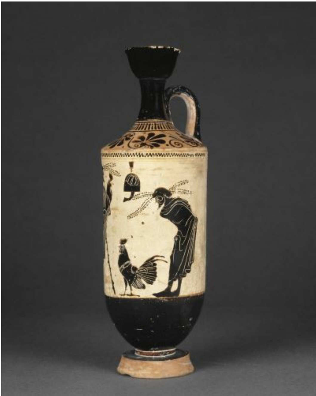
Fig. 4 Preparativi di un combattimento di galli, lecite, Atene, fine del VI secolo a.C. Musée du Louvre, F368.