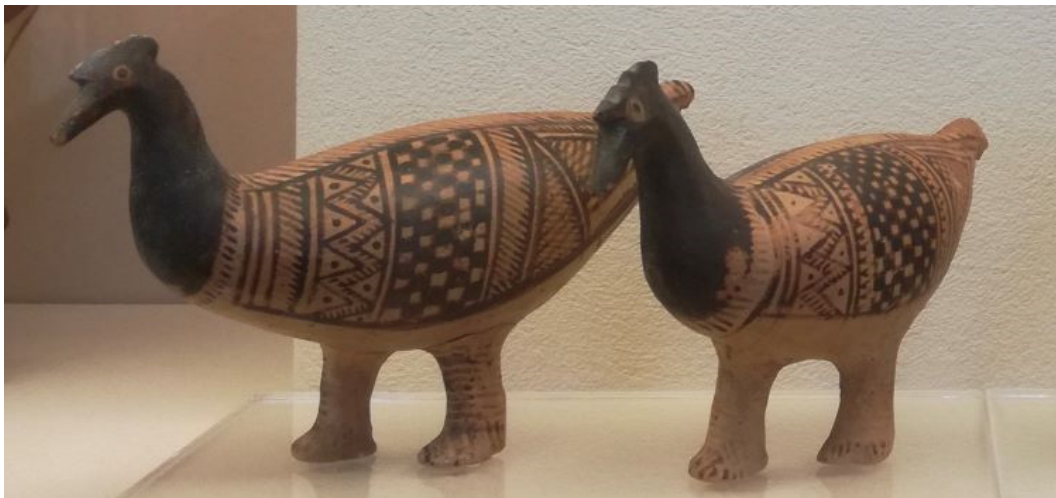
Fig. 2 Due statuette di uccelli dal Ceramico, Athènes, circa 750-700 a.C. Museo del Ceramico, n° T 50/V.