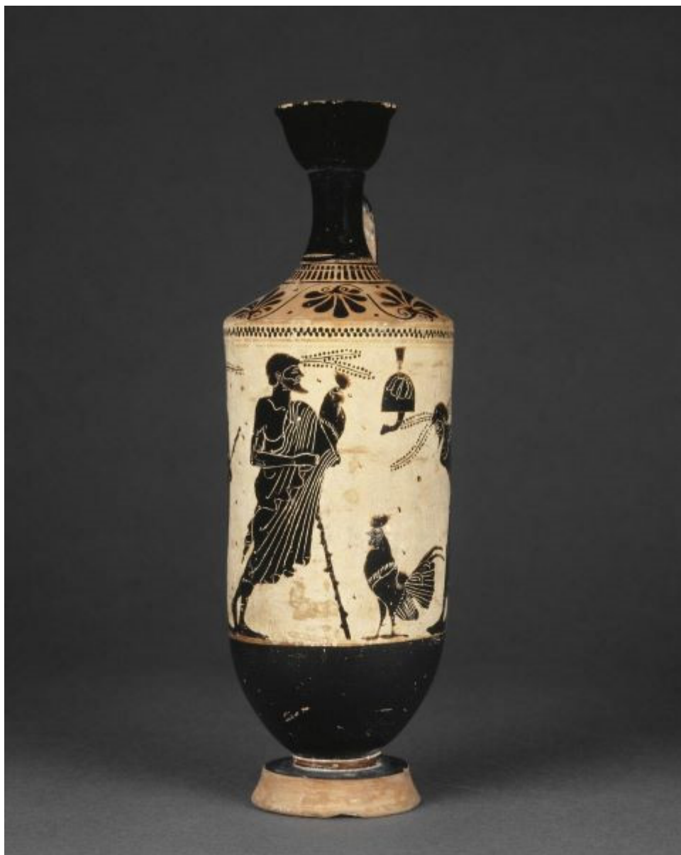
Fig. 5 Preparativi per un combattimento di galli, lecite, Atene, fine del VI secolo a.C. Musée du Louvre, F368.