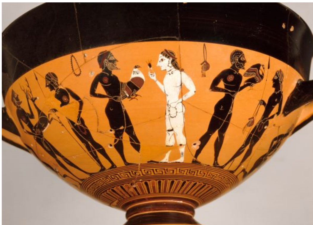
Fig. 16 Skyphos del pittore di Amasis: una gallina offerta a una donna, Atene, circa 540 a.C. Musée du Louvre, A479.