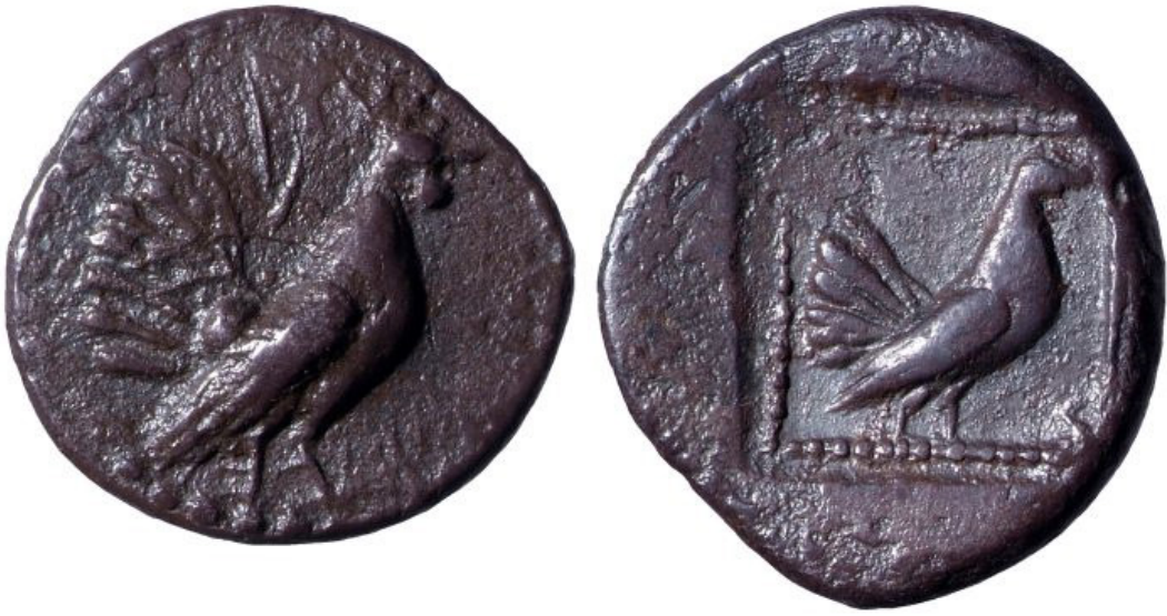
Fig. 9 Dracma d'Imera con gallo e gallina, inizi del V secolo a.C., British Museum, 1928,0120.35 © The Trustees of the British Museum.