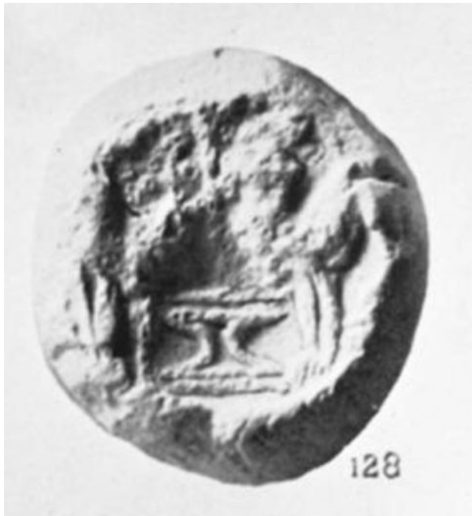
Fig. 1 Sigillo da Zakros, Creta, II millennio a.C., da Hogarth 1902: pl. X, n° 128.