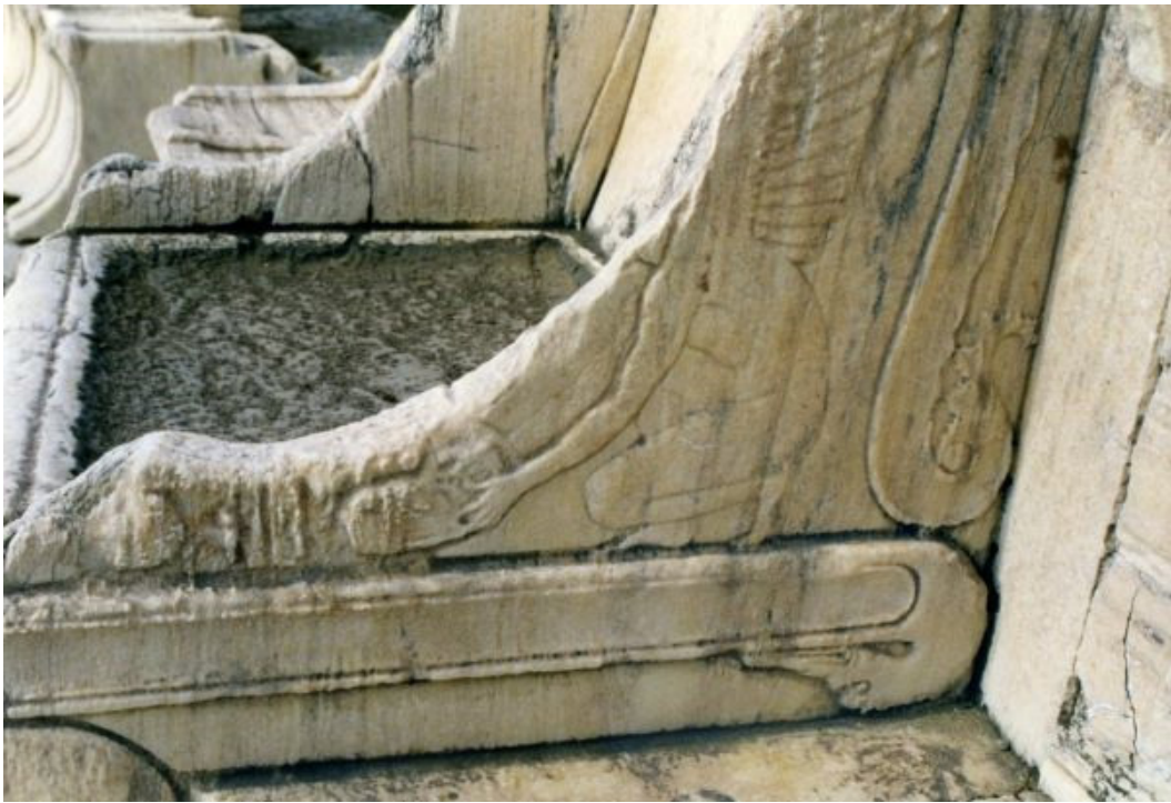
Fig. 14 Braccioli e parti laterali dello scranno del prete di Dioniso, Teatro di Dioniso, Atene, Photo © Christophe Vendries.