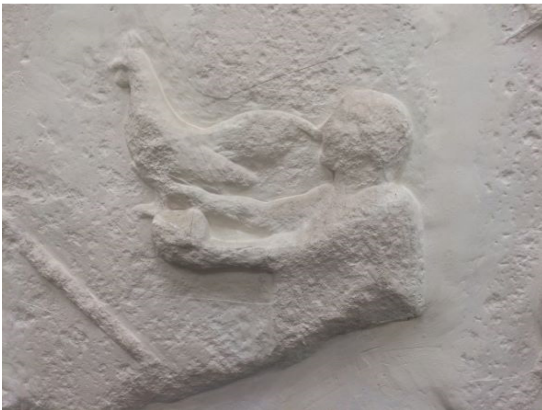
Fig. 6 L'offerta di un gallo, monumento delle Arpie, Xanthos, circa 500-480 a.C. Originale al British Museum, (1848,1020.1), calco dal Musée des Moulages de l'Université de Montpellier 3, A-058.