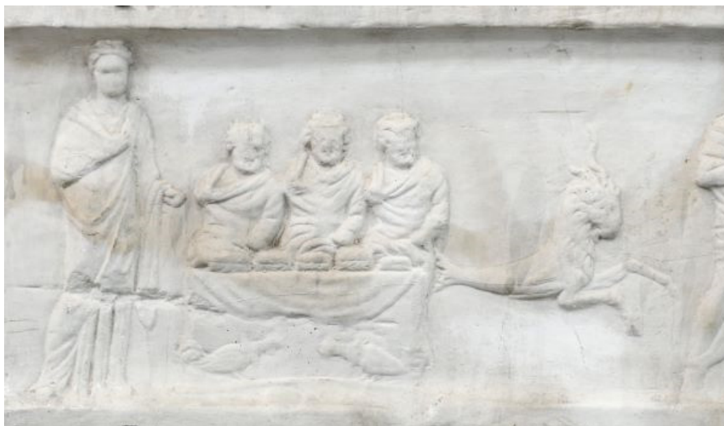
Fig. 15 Il combattimento di galli del calendario della Piccola Metropoli, Atene, calco dal Musée des Moulages, Université Montpellier 3, A-327 Photo © Marc Dantan.