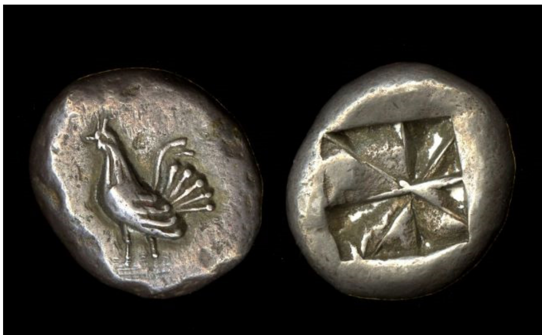
Fig. 8 Statere di Karystos, con gallo, fine del VI secolo a.C., British Museum, 1896,0601.42 © The Trustees of the British Museum.