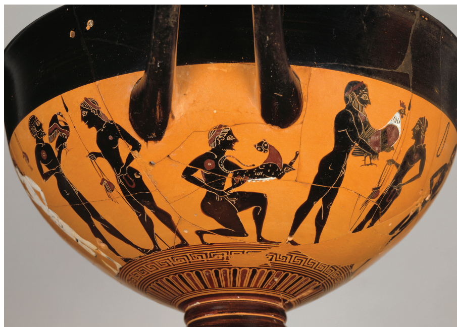
19. Skyphos du peintre d'Amasis : un coq offert à un éphèbe, Athènes, vers 540 av. J.-C. Musée du Louvre, A479.