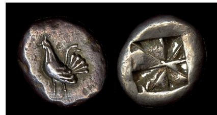
10. Statère de Karystos, avec coq, fin du VI e siècle av. J.-C.