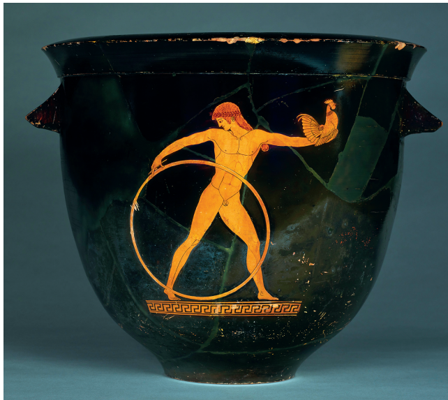
9. Cratère avec Ganymède au cerceau et au coq, peintre de Berlin, Athènes, vers 500-490 av. J.-C. Musée du Louvre, G175.