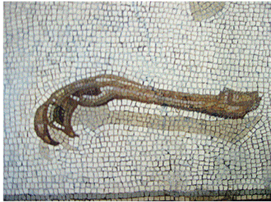
1. Patte de poulet sur la mosaïque de la Vigna Lupi, II e siècle apr. J.-C. Museo Gregoriano Profano, 10132.

du Haut-Empire à Éphèse, la consommation de viande de poule et de coq est bien attestée par l'archéozoologie et les listes de dépenses gravées sur les enduits peints 8 . Cette importance de la viande et de l'œuf de poule ne nous étonne pas : ce sont actuellement des aliments très courants, voire bas de gamme. Il n'en a pourtant pas toujours été ainsi.