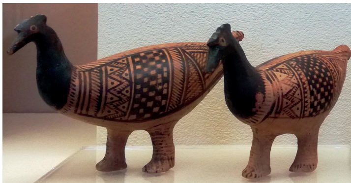
4. Deux statuettes d'oiseaux du Céramique, Athènes, vers 750-700 av. J.-C. Musée du Céramique, n° T 50/V.

Il y a cependant bien, en Grèce, une présence iconographique du coq dès la période 750-700 av. J.-C. Elle se manifeste d'abord sous la forme de figurines en bronze représentant indubitablement des coqs. On en a trouvé à Olympie, Argos ou Lindos. Vers la fin du VIII e siècle av. J.-C. apparaissent aussi les premières images de coqs sur des vases protoattiques et protocorinthiens 28 . Il reste néanmoins difficile d'assurer que ceux qui ont produit ces images avaient réellement vu