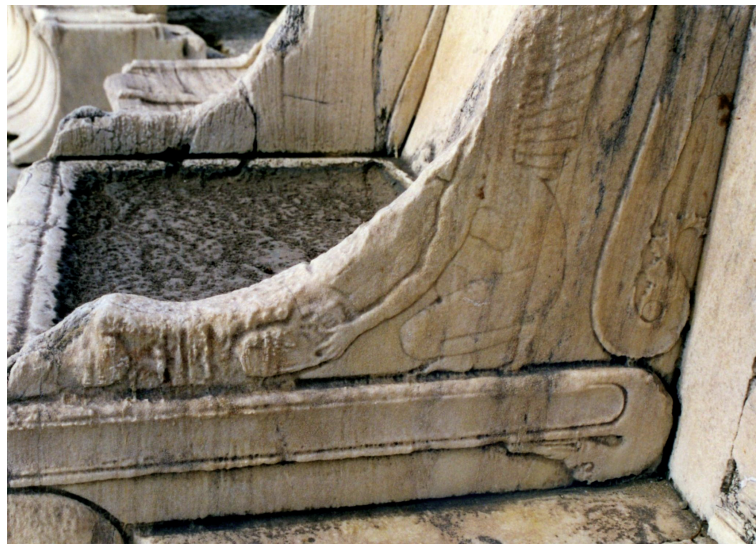
16. Accoudoirs du siège du prêtre de Dionysos, théâtre de Dionysos, Athènes.

À un certain moment, à Athènes, les combats de coqs ont fini par être institutionnalisés, ce qui veut dire que la cité se mit à prendre en charge l'organisation de combats. Chaque année, il y en avait un dans le théâtre de Dionysos. Le passage d'Élien à propos de Thémistocle fait remonter cela aux guerres médiques. L'information s'appuie sur un réel dossier, dont le décor sur les accoudoirs du siège du prêtre de Dionysos Éleuthereus dans le théâtre. Sa datation débattue oscille entre le IV e siècle av. J.-C. et l'époque antonine (fig. 16) 101 . On voit un personnage nu, Éros ou plutôt Agôn 102 , qui tend un coq prêt à attaquer : le coq adverse est présent, à terre, sculpté dans l'amortissement de l'accoudoir. Les combats de coqs apparaissent aussi sur le calendrier de la Petite Métropole pour le mois de Poseidôn, là encore, comme s'il s'agissait d'un spectacle institutionnalisé. On date aujourd'hui ce relief de l'époque impériale (fig. 17) 103 . Lucien, toujours à l'époque impériale, suggère également que la loi imposait aux adolescents d'assister à ces combats, dans le but de leur enseigner l'esprit guerrier 104 .