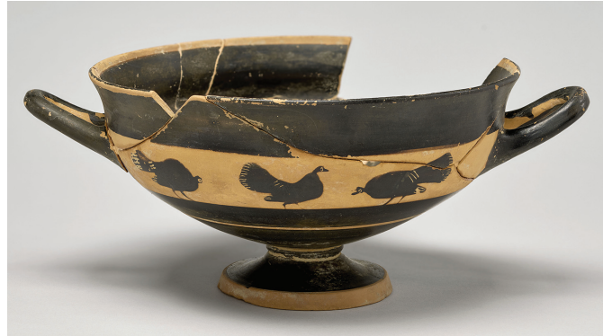
13. Coupe des petits-maîtres, avec coqs et poules, Athènes, vers 550-525. av. J.-C. Musée du Louvre, Elé36.