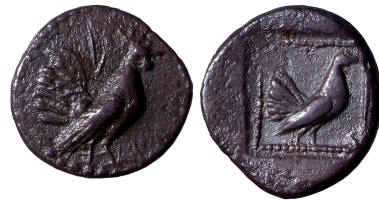
11. Drachme d'Himère avec coq et poule, début du V e siècle av. J.-C.