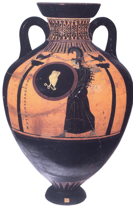
5. Athéna, les deux colonnes et les deux coqs sur une amphore panathénaïque, Athènes, vers 500-475 av. J.-C. Musée Vivenel, Compiègne, L.986.

comme sur un lécythe du Louvre de la fin du VI e siècle av. J.-C. où deux propriétaires tiennent chacun leur champion, l'un déjà à terre, l'autre encore dans les bras de son maître (fig. 6 et 7) 48 . Un spectateur – ou un juge – est là. Au mur, est suspendu ce qui semble être une cage de transport, en grec un kalios ou une kalia 49 . C'est une scène de prélude au combat. La mise en présence des deux coqs stimule l'agressivité de ces mâles. Le goût des combats de coqs était répandu en cette période de la fin du VI e siècle et du début du V e siècle av. J.-C. et Eschyle y fait une allusion dans Les Euménides , en 458 av. J.-C., mais en mauvaise part. Ils symbolisent la discorde entre citoyens 50 .