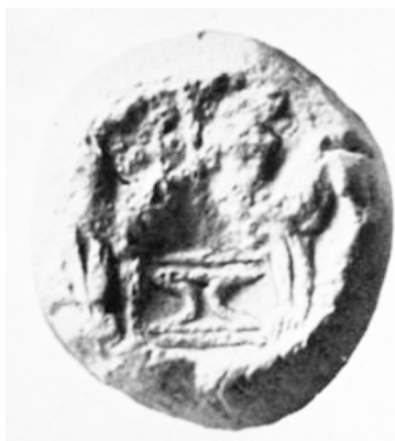
3. Sceau de Zakro, Crète, II e millénaire av. J.-C. (d'après Hogarth 1902, pl. X, n° 128).

Les supposés plats tripodes à œufs d'époque minoenne pouvaient aussi bien servir pour des escargots, des œufs d'oiseaux domestiques comme des œufs d'oie ou même d'espèces sauvages 22 . On croit aussi reconnaître des coqs entourant un autel sur un sceau minoen de Zakro, et c'est assez convainquant (fig. 3) 23 . Les arguments en faveur d'une connaissance du coq dans l'Égée du II e millénaire av. J.-C. sont donc rares et contestés 24 . On peut au mieux proposer l'arrivée de quelques individus à titre de curiosités et de rares indices archéozoologiques semblent aller dans ce sens 25 . Pour la Grèce géométrique, les représentations de coqs demeurent rares. On a parfois cru en reconnaître dans deux statuettes de la seconde moitié du VIII e siècle av. J.-C. qui faisaient partie du matériel de l'une des plus riches tombes géométriques du Céramique d'Athènes, mais l'identification n'est guère assurée. La forme du corps ne va pas dans ce sens et il manque des éléments caractéristiques de l'espèce comme la queue avec ses plumes en faucille. Le seul élément auquel cette identification pourrait s'accrocher est la crête qui ne se retrouve pas chez d'autres galliformes comme les perdrix (fig. 4) 26 . Sur un vase géométrique, Philippe Bruneau avait suggéré de reconnaître un coq et une poule. L'identification semble encore moins probante 27 .