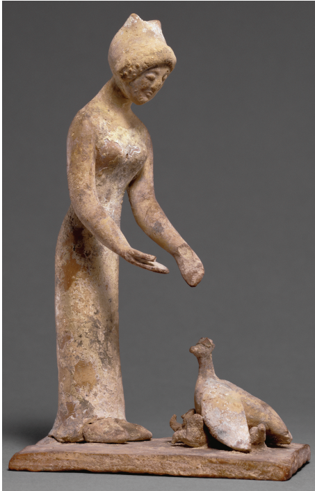
12. Statuette d'une femme nourrissant une poule et ses poussins, Béotie, vers 500-475 av. J.-C. J. Paul Getty Museum, Villa collection, Malibu, California, gift of B. and L. Fleischman, n° 96.AD.101.