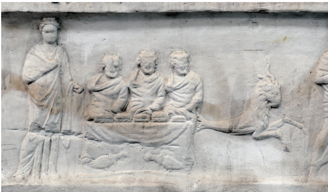
17. Le combat de coqs du calendrier de la Petite Métropole, Athènes. Moulage du musée des Moulages, université Montpellier 3, A-327.

Tout cela pose le problème de l'époque de cette institutionnalisation. Certains la font remonter au VI e siècle av. J.-C., d'où les coqs des colonnes encadrant Athéna sur les amphores panathénaïques 105 . On est en droit d'en douter, comme de la datation aux lendemains de la seconde guerre médique que suggère Élien. Les documents parlant de cet agôn institutionnalisé rapportent certes la pratique à l'époque classique, mais datent tous de l'époque impériale 106 . On peut au mieux situer l'institutionnalisation athénienne au IV e siècle av. J.-C., mais sur l'unique base du décor du théâtre de Dionysos. L'ambiance patriotique de l'époque de Lycurgue fournirait un contexte possible 107 . Une autre date dans le courant du II e siècle av. J.-C. est envisageable. En 146/5 av. J.-C., deux monétaires athéniens, Charias et Hérakleidès, choisissent comme différent pour les tétradrachmes à la couronne qu'ils font frapper un coq avec une palme dans son bec 108 . Une institutionnalisation remontant alors aux années 170-160 av. J.-C. s'expliquerait car elles voient une profonde réorganisation de la vie agonistique athénienne 109 . On ne doit enfin pas écarter l'hypothèse d'une institutionnalisation en pleine époque impériale. Le plus probable est donc qu'à