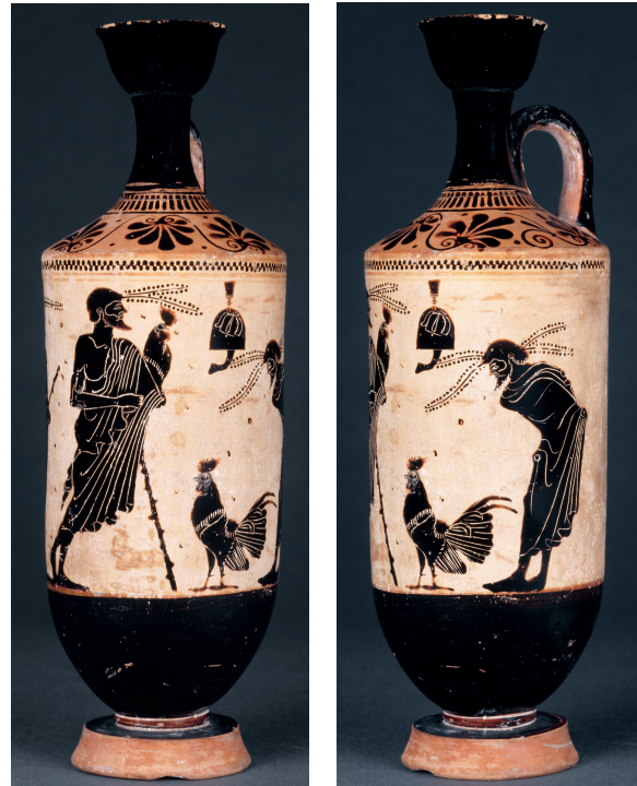
6 et 7. Préparatifs d'un combat de coqs, lécythe, Athènes, fin du VI e siècle av. J.-C. Musée du Louvre, F368.

Cette période de la fin de l'Archaïsme voit se multiplier l'image du coq seul, dans des contextes militaire, religieux, érotique ou funéraire. Un coq apparaît sur la face est du monument funéraire des Harpyies à Xanthos en Lycie, vers 500-480 av. J.-C., où il est apporté en offrande soit à un défunt, soit à une divinité (fig. 8) 51 . C'est un des éléments qui tissent un lien entre le