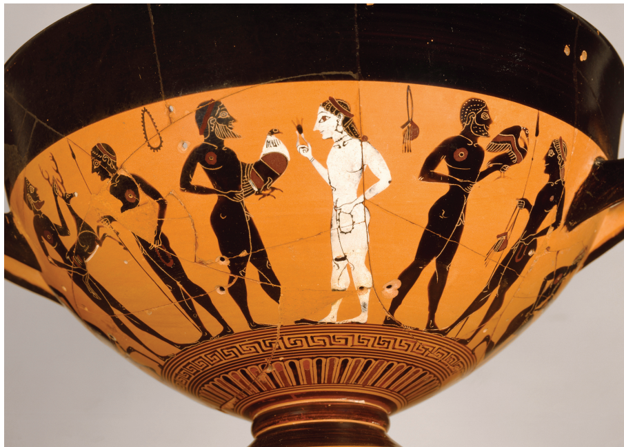
18. Skyphos du peintre d'Amasis : une poule offerte à une femme, Athènes, vers 540 av. J.-C. Musée du Louvre, A479.