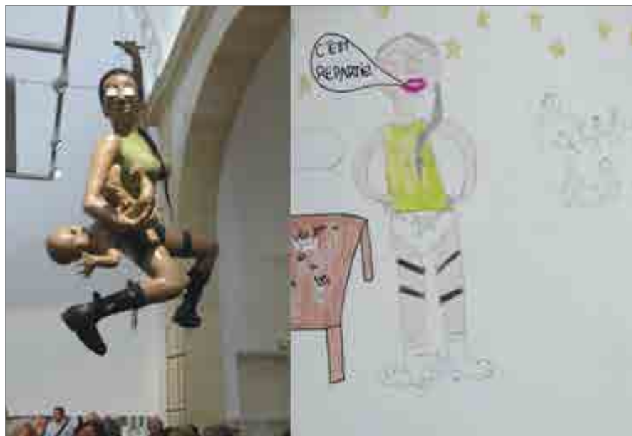
ILLUSTRATION 7 : Travail de Floor (détail) d'après l'œuvre d'Olivier BLANCKART : Toodle raider , 2008 (coll. C. & M. Poitevin)

Si les premiers dessins, réalisés au sein de l'exposition, en montraient le dispositif (socle, mur blanc, espace attribué aux visiteurs), les strips recontextualisent les œuvres et contribuent en cela à questionner l'importance de ce dispositif de monstration dans l'affirmation de leur statut d'œuvres d'art. Cela peut se résoudre de façon très simple : la sculpture d'Olivier Blanckart représentant Lara Croft devient Lara Croft. Pour les autres exemples, l'opération de changement de contexte mobilise des ressorts narratifs plus subtils : les ventilateurs de Kempinas, déplacés dans un paysage de montagne, deviennent des personnages fascinants et surdimensionnés, ce qui informe peut-être sur la manière dont la jeune dessinatrice les a perçus. C'est ce qui me frappe le plus dans ces dessins : le fait que les sculptures y soient toutes mises en mouvement. Certes, certaines bougent réellement, et les autres présentent une plastique ou une thématique propres à évoquer le dynamisme. Mais on peut aussi supposer que ce que Piaget appelait, dès 1926, l'animisme enfantin 28 , constitue un mode d'appréhension de l'art, et pas seulement chez l'enfant (pensons au succès des animations de tableaux célèbres diffusées par Arte sous le titre A Musée Vous, A Musée Moi ).