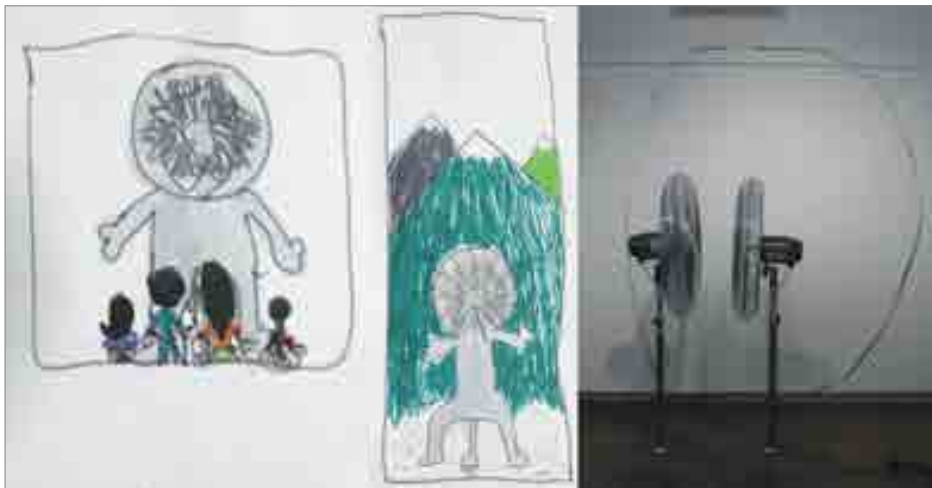
ILLUSTRATION 6 : Travail de Manar (détail) d'après l'œuvre de Zilvinas KEMPINAS : Double O , 2008 (coll. C. & M. Poitevin)