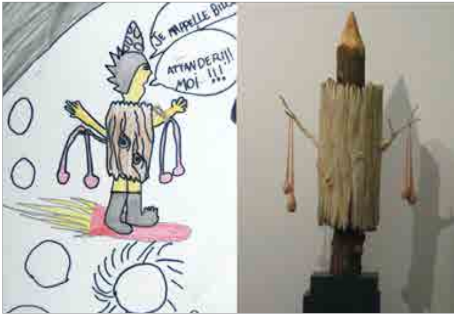
ILLUSTRATION 5 : Travail de Firmin (détail) d'après l'œuvre de Théo MERCIER : L'arbre de la connaissance , 2010 (coll. C. & M. Poitevin)