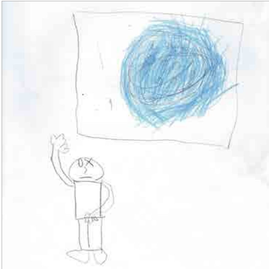
ILLUSTRATION 2 : Dessin de Clément d'après l'œuvre de Céleste BOURSIER-MOUGENOT : Sans Titre Piscine , 2010 (coll. C. & M. Poitevin)

Le dessin de Clément [ILLUSTRATION 2] peut sembler moins virtuose, mais le mouvement des bols y est, rendu par un geste tourbillonnant énergique, ainsi que, sur le visage du visiteur, une sensation d'étonnement résumée en deux yeux, l'un ouvert, l'autre fermé, que nous pourrions interpréter déjà comme une sensation d' éstrangement .