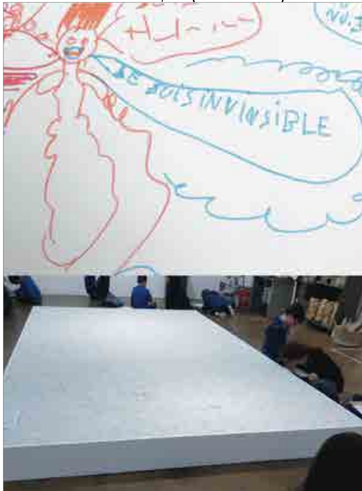
ILLUSTRATION 8 : Travail d'Amin (détail) d'après l'œuvre de Leandro Erlich : Piedras , 2003 (coll. C. & M. Poitevin)