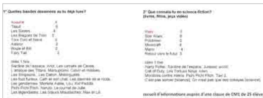
ILLUSTRATION 3 : Enquête sur les connaissances de la classe de CM1 en matière de BD et de SF

Un petit questionnaire écrit finit de faire le point sur la culture des élèves (ils sont 25) en matière de SF, mais aussi de bande dessinée. Les résultats [ILLUSTRATION 3] montrent une culture BD assez inattendue ; non pas dans l'absence des « classiques » de ma génération (pas de Tintin 16 ni de Spirou 17 ), mais dans la faiblesse d'implantation des mangas (personne n'a cité One Piece 18 ). Côté SF, le domaine n'est que très peu circonscrit et l'amalgame est fait avec l'imaginaire général des jeux vidéo (créatures, suspension de la gravité) et la science en général (deux émissions de télévision populaires sont citées).