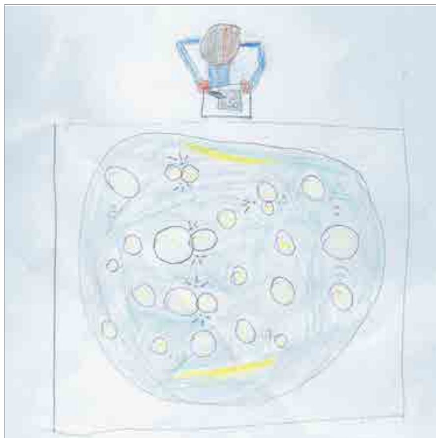
ILLUSTRATION 1 : Dessin de Suzanne d'après l'œuvre de Céleste BOURSIER-MOUGENOT : Sans Titre Piscine , 2010 (coll. C. & M. Poitevin)

Confrontons deux dessins d'enfants de 9 ans, réalisés en prenant pour modèle la piscine de Boursier-Mougenot. Dans celui de Suzanne [ILLUSTRATION 1], le parti-pris du point de vue surplombant est rigoureusement respecté. Sur la surface de l'eau, l'élève a dessiné des petits traits pour évoquer le tintement des bols de faïence s'entrechoquant, et aussi des segments jaunes, qui représentent les reflets des tubes fluorescents du plafond, en synecdoque de l'architecture du lieu. Par un remarquable hasard, Suzanne était vêtue d'une chemise bleue à boutons blancs, assortie à l'œuvre, qu'elle a non moins scrupuleusement dessinée.