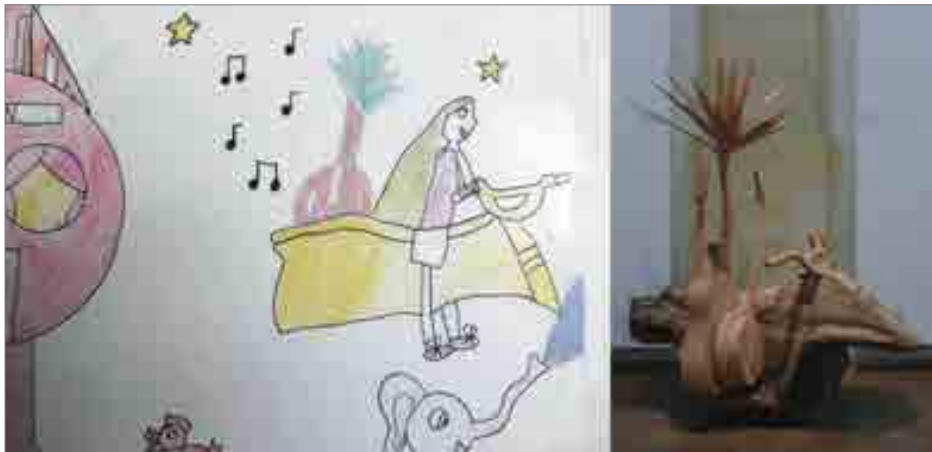
ILLUSTRATION 4 : Travail de Louise (détail) d'après l'œuvre de DEWAR & GICQUEL : Kentucky chesnut breakdown , 2004 (coll. C. & M. Poitevin)