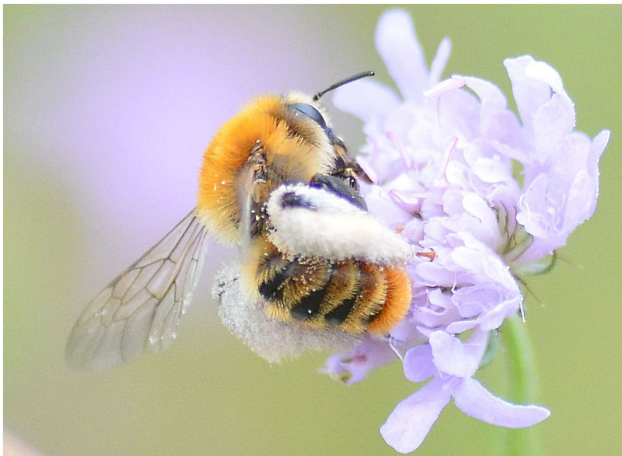
Figure 2. Femelle de Dasygaster argyrea butinant une scabieuse en Indre-et-Loire (Puy Besnard, Chinon). Photo P. BOURLET (août 2017).

Au cours du travail de production de cette liste, nous avons collecté 35 données historiques, datant d'avant 1990, correspondant à 29 espèces (tableau II).