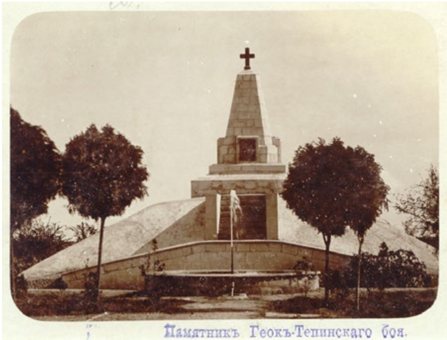
Image 5. Monument commémorant la bataille de Gëk-Tépé, par l'ingénieur militaire Ivan I. Chevalier de la Serre, 1901.

Carte postale, sans éditeur (approximativement entre 1903 et 1910). Svetlana Gorshenina