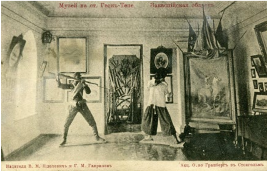
Image 6. Musée de Gëk-Tépé. Carte postale. Éditeurs V. M. Judolovič et G. M. Gavrilov ; société d'actionnaires Granberg à Stockholm. S/d, mais après 1902.

quelques petits ajustements l'exposition n'a pas changé d'aspect durant les 29 années de son existence, jusqu'en 1918 29 (voir l'image 6 ci-dessous).