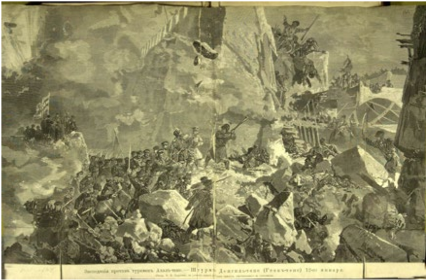
Image 4. L'assaut de Gök-Tepe, 12 janvier.

démolie vers 10 heures. Cinquante minutes plus tard, l'artillerie dirigée par le colonel Kuropatkin ouvre le feu sur l'angle sud-ouest de la forteresse où elle attire les défenseurs tékés, probablement au nombre de sept cents 12 , pour les piéger dans l'explosion qui survient trente minutes plus tard quand, à 11 heures 20, une charge de 72 pouds (1180 kg) de poudre à canon déposée dans la sape explose et provoque un énorme affaissement permettant de franchir facilement la muraille (voir l'image 4 ci-dessous).