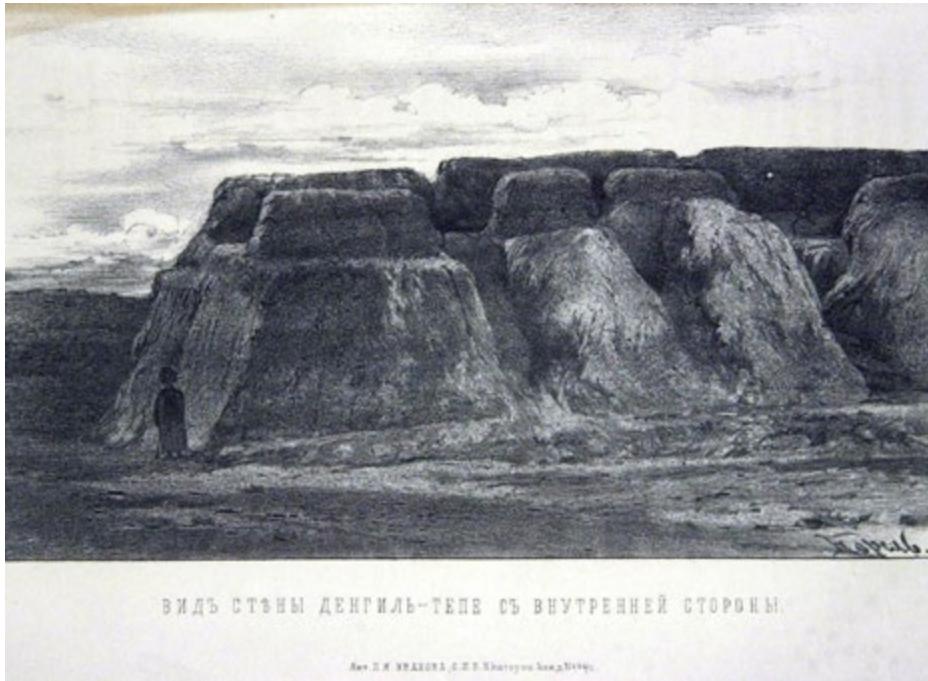
Image 7. Vue de la muraille de Dengil-Tépé, côté intérieur. Lithographie de P. Ja. Ivanov. Nikolaj I. Grodekov, Vojna v Turkmenii . 1883, entre p. 204 et p. 205.

Photographiée, dessinée, lithographiée, elle reste un symbole de cette bataille, bien que sa maçonnerie ait été fortement rabattue lors de l'enterrement des cadavres de 1881. Ne pouvant plus être perçue comme un obstacle sérieux, l'enceinte donne, selon les vétérans, une impression erronée du véritable contexte du siège. Jugeant que cela diminue les « mérites » de l'armée russe, ils proposent de rétablir la hauteur initiale des murailles 31 , projet qui n'a jamais été réalisé. Leurs craintes semblent justifiées : ce changement de paysage avec une forteresse aux murailles désormais réduites, amène inévitablement à se demander si l'importance de la victoire et le courage des soldats russes, qui ont mis tant de temps à s'emparer de ce monticule, n'ont pas été exagérés. Ainsi, la commémoration devient de plus en plus ambiguë et mitigée : la nécessité d'enterrer des milliers de victimes a créé un paysage qui rabaisse le mérite des vainqueurs.