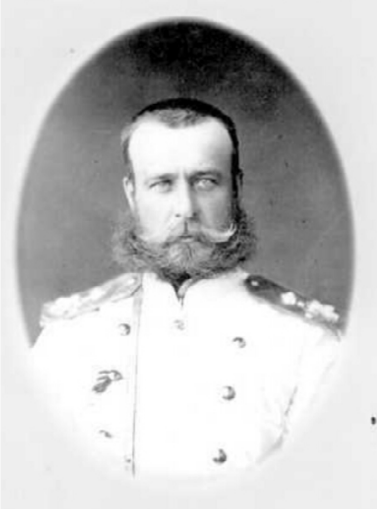
Image 2. Mihail Skobelev à Ahal-Téké.

Mais, pour moi, le nom de ce vin est avant tout le symbole de l'assaut lancé en 1881 par le général Mihail Dmitrievič Skobelev (voir l'image 2 ci-dessous) contre la forteresse de Gök-Tépé, située à 45 km au nord-ouest d'Achkhabad, la capitale du Turkménistan actuel.