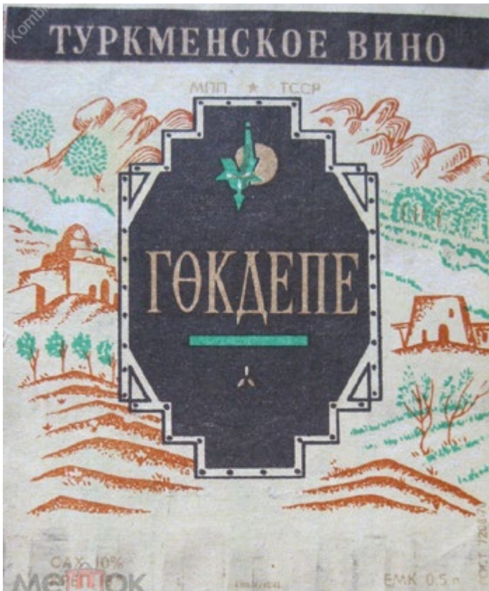
Image 1. Étiquette sur une bouteille de vin « Gökdepe ». Svetlana Gorshenina

Une bouteille de vin rouge décorée d'une étiquette « Gökdepe » (voir l'image 1 ci-dessous) avec un paysage bucolique peut-elle devenir une sorte de Time Machine pour revenir dans le passé ? Elle pourrait ainsi servir de prétexte pour une réflexion sur l'histoire millénaire de la vigne dans les piémonts du Kopet-Dag, ou sur le travail des agronomes soviétiques grâce auxquels le sovkhoze « Gök-Tépé » a été promu au rang des plus importants centres républicains de production viticole, ou, encore, sur les efforts du Turkménistan indépendant pour préserver cette tradition tout en l'adaptant à d'autres exigences.