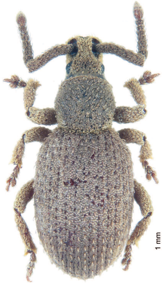
Fig. 1. – Meira cantoti n. sp., mâle paratype, habitus.

Rostre subcarré; ptérygies peu saillantes; épistrostre incurvé, graduellement élevé sur le front. Yeux un peu aplatis. Antennes à scape géniculé, très robuste, subcylindrique dans son premier tiers, puis un peu élargi entre celui-ci et l'apex; funicule avec les articles 3-7 transverses mais un peu plus minces que le scape, le 7 e moins que deux fois plus large que long.