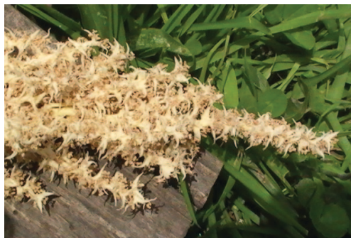
Fig. 1. – Inflorescence mâle de Ceroxylon quindiuense échantillonnée (partie sommitale).

Dans le cadre d'une étude plus générale sur les insectes pollinisateurs des Palmiers néotropicaux (KIREJTSHUK & COUTURIER, 2009), une nouvelle espèce du genre Terioltes Champion, 1903, a été collectée sur une inflorescence mâle en anthèse de Ceroxylon quindiuense (H. Karst.) H. Wendl. (Arecaceae) ou Palmier à cire (fig. 1). C'est un Palmier dioïque, de grande taille, le stipe pouvant atteindre 60 m de haut ; il forme de denses populations naturelles dans les Andes, du Venezuela à la Bolivie, entre 800 à 3500 m d'altitude (HENDERSON et al. , 1995 ; GALEANO et al. , 2008) ; les stipes sont exploités dans la construction. Deux espèces de Terioltes sont connues d'Amérique Centrale, T. circumdatus Champion, 1903, du Costa Rica et du Panama, et T. nigripennis Champion, 1903, du Guatemala,