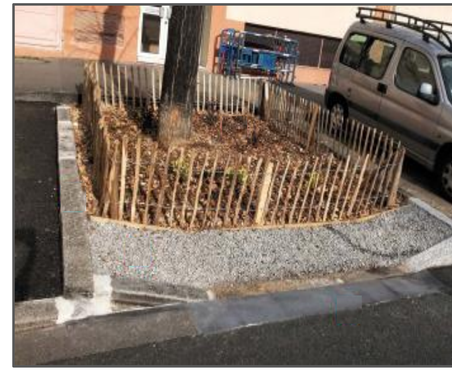
Métropole de Lyon - Livret technique