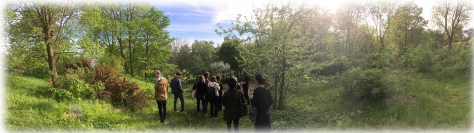
Färjenäs Forest Garden (Göteborg)