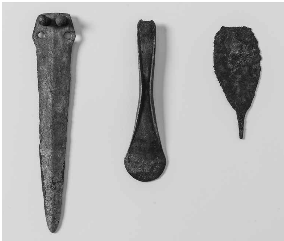
Fig. 2. Association composée de poignard, rasoir et hache du village péri-lacustre de Viverone, au Piémont (Rubat Borel 2014, fig. 17).