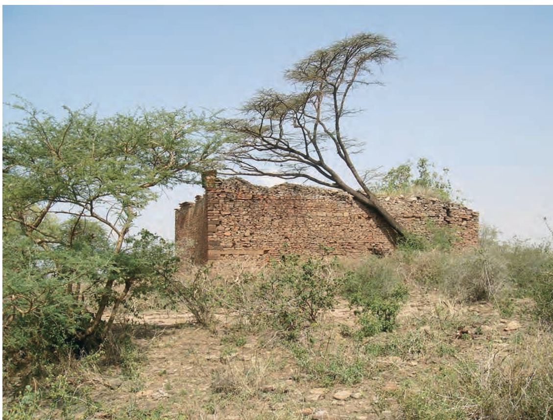
FIG. 1.2. Nora : la Grande Mosquée en 2007.