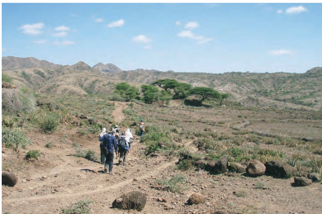
FIG. 1.3. La montée depuis Wässisso en direction des collines de Rassa.

C'est sur la base des observations effectuées durant ces missions de repérage que fut décidée la réalisation d'une campagne de fouilles archéologiques à Nora. Celle-ci eut lieu du 24 avril