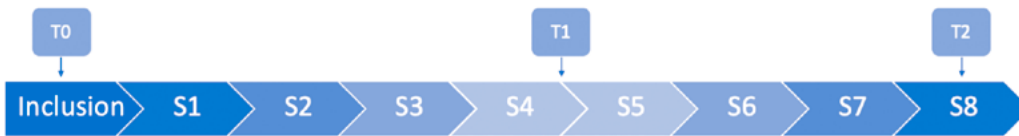
Figure 2. organisation de l'évaluation psychométrique chez les participants