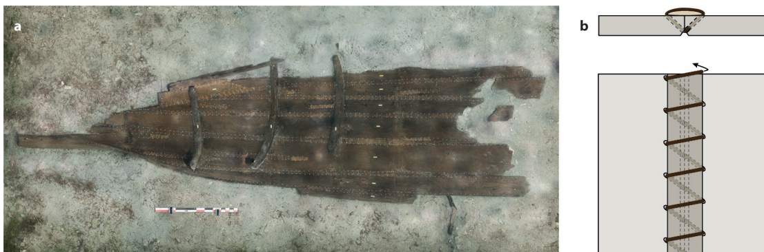
2. L'épave de Zambratija : a. ortho-image (© V. Dumas, CNRS/CCJ, © Adriboats) ; b. Schéma de couture (© P. Poveda, CNRS/CCJ, © Adriboats).

Long d'environ une dizaine de mètres et vraisemblablement propulsé à la pagaie, ce bateau daté entre la fin du XII e et la fin du X e siècle av. J.-C. se caractérise par un fond arrondi, des flancs ouverts et un profil longitudinal en croissant (fig. 2a) 108 . La quille-planche est issue du creusement d'un demi-tronc d'orme selon une technique utilisée pour le façonnage des monoxyles. Le bordé, également en orme, est assemblé au moyen de ligatures simples (schéma ///) qui enserrrent de fines lattes de sapin posées sur les joints des virures (fig. 2b). Les liens sont bloqués par deux à trois petites chevilles pointues en aulne et en peuplier. Les varangues en aulne et poirier sauvage sont assemblées au bordé par des ligatures externes. Une couche de poix recouvre la coque. L'emploi exclusif des ligatures pour les assemblages et de techniques spécifiques pour le travail du bois s'accorde bien avec la datation très ancienne de cette embarcation.