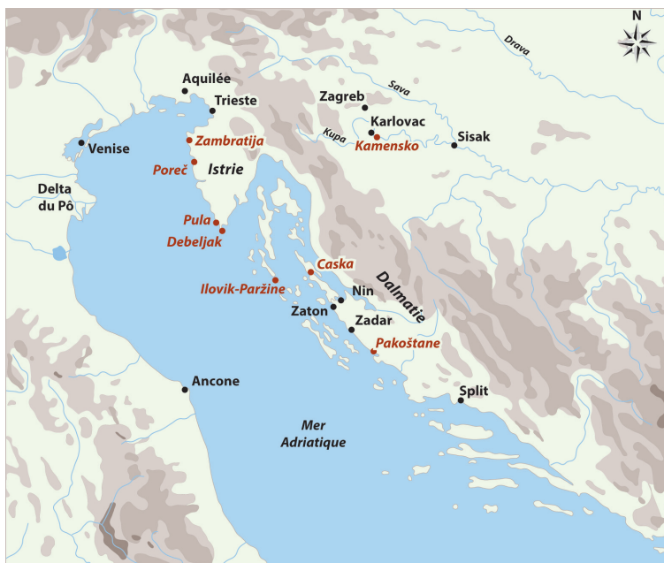
1. Carte indiquant les lieux cités dans l'article ; en rouge, les épaves fouillées dans le cadre des programmes franco-croates.

Rossi en a repris le flambeau à partir des années 2000 au sein de l'université de Zadar. En parallèle, les musées archéologiques d'Istrie et de Zadar et l'Institut de conservation croate de Zagreb – pour ne citer que les institutions les plus actives – ont promu des fouilles centrées sur l'étude architecturale des navires. Dans ce mouvement, le Centre Camille Jullian (CCJ) a joué un rôle de premier plan en apportant son expertise et en contribuant à la formation d'étudiants et de jeunes chercheurs 103 .