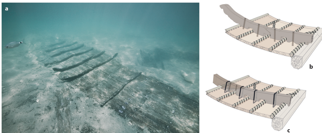
3. a. Vue de l'épave Caska 1 ; axonométries des deux variantes : b. Caska 1 et 3, Pula 2 , Poreč 1 ; c. Caska 4.

Les deux variantes montrent des caractères communs. La section maîtresse est plate avec un bouchain arrondi et des extrémités convexes. D'une longueur restituée allant de 7,5 m ( Poreč 1 ) à environ 10 m ( Caska 1 ) [fig. 3a et b], tous ces bateaux cousus ont une propulsion mixte, à la voile et à la rame 113 . La quille est simple sans chanfreins et les planches du bordé ont été débitées par fendage radial de troncs de hêtre 114 . Les virures sont assemblées avec des tresses à trois brins 115 selon un schéma longitudinal simple (schéma /// ; fig. 4b). Ces tresses sont bloquées par des petites chevilles tronconiques, issues de plusieurs types de conifères, notamment du sapin, qui sont enfoncées dans les canaux aménagés dans le bordé. Les liens enserrant des bourrelets constitués de fibres compactes placées sur les joints entre les virures 116 . La plupart des membrures, fabriquées à partir de caducifoliés, sont constituées de varangues crénelées à la base pour éviter d'écraser les bourrelets. Le massif d'emplanture du mât est simplement encastré sur les membrures et le vaigrage est cloué aux membrures 117 . Le système est complété par une couche de poix 118 . On notera que des traces d'un colorant rouge à base de cinabre ont été détectées sur la surface externe du bordé de Poreč 1 119 .