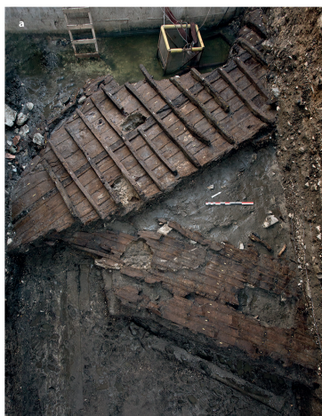
4a. Vue des épaves Pula 1 (en haut de l'image) et Pula 2 (en bas de l'image) ; schémas de couture : b. Pula 2 ; c. Pula 1.