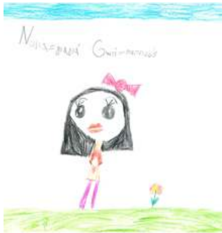
Figure 3 : Dessin réflexif d'élève d'origine albanaise