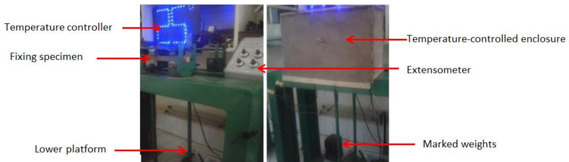
Fig.1 : Dispositif expérimental pour la détermination du MOE en fonction de la température.

Pour chacune des deux essences, les éprouvettes ont été testées à des niveaux de température de 25°C, 30°C, 35°C, 40°C, 45°C, 50°C, 60°C, 70°C, 80°C, 90°C et 100°C, respectivement, puis les MOEs calculés en évaluant la pente de la courbe contrainte-déformation correspondante.