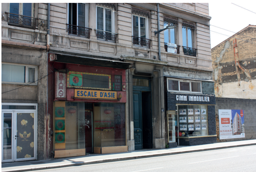
Figure 7. Vitrine à l'abandon et opération de démolition-construction en haut du cours Tolstoï