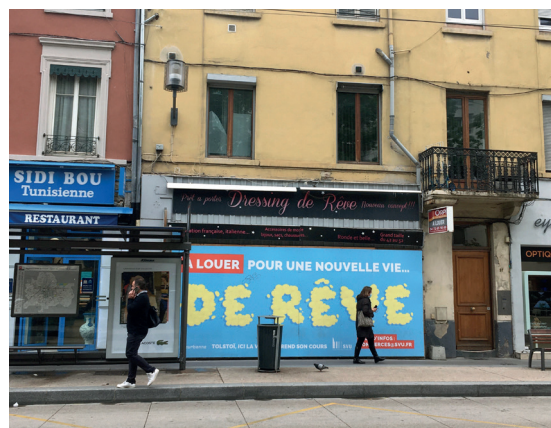
Figure 9. Local proposé à la location par la SVU au 27 cours Tolstoï

En agissant sur certains commerces en rez-de-chaussée et en ravalant quelques façades, il s'agit donc d'insuffler une dynamique de développement local aux effets sociaux supposés vertueux et de « faire en sorte que le cours soit bien habité de jour comme de nuit » 28 .