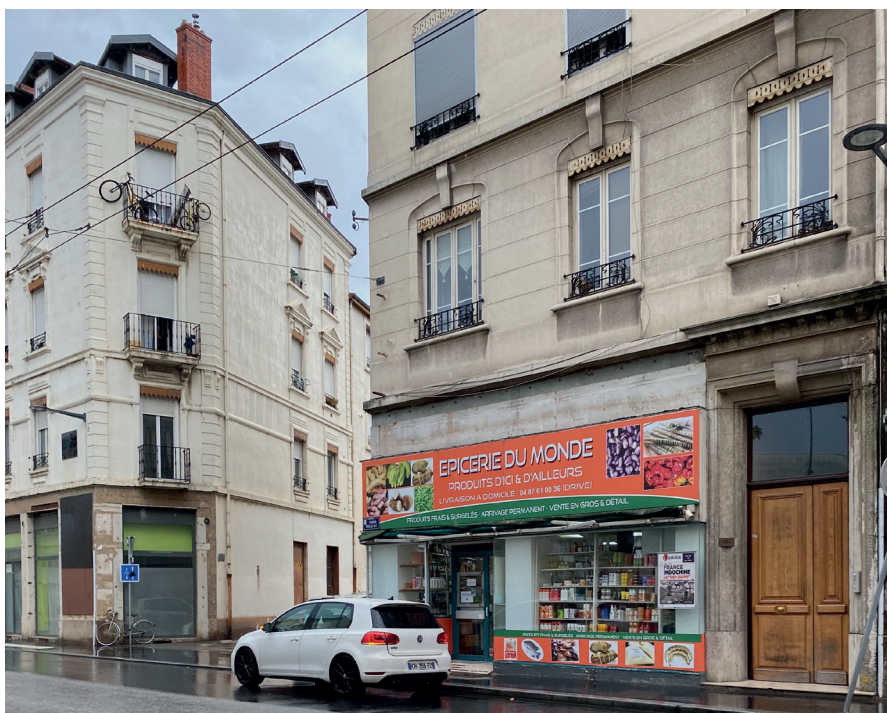
Figure 6. Commerce post-migratoire du cours Tolstoï au 146 bis Source : K. Bennafla, août 2022

Le développement croissant de types de commerces dirigés vers des consommateurs musulmans, soucieux des caractères halal des produits carnés consommés, concerne le cours Tolstoï. Ainsi, toutes les boulangeries du cours Tolstoï utilisent de la viande halal , parfois sans l'afficher de façon ostensible. L'idée de proposer une « bonne boucherie qui donne envie » grâce à une démarche qualité fut, par exemple, au cœur du projet de la moyenne surface alimentaire Es Market , ouverte en 2020, qui ciblait initialement une « clientèle captive dans le quartier » et qui