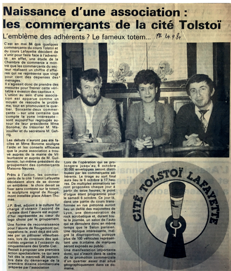
Figure 8. L'association commerçante de la cité Tolstoï-Lafayette avec l'emblème du Totem au début des années 1980 ( Le Progrès , 29 avril 1984)