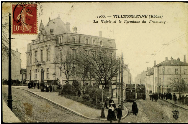
Figure 3. Le cours Tolstoï (à droite) et la mairie de Villeurbanne (au centre) au début du 20 e siècle, sur l'actuelle place Jules-Grandclément (carte postale)