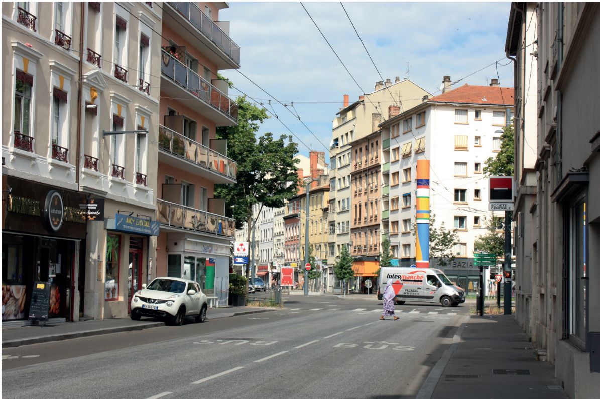
Figure 2. Place Albert-Thomas avec le Totem, vue en direction du cours Lafayette Au sol, les couloirs du bus C3 en site propre. À gauche, une façade ravalée. Source : K. Bennafla, juin 2021

Tolstoï. Appuyé sur le constat d'une déshérence commerciale, ce dispositif de maîtrise foncière vise in fine à requalifier un quartier d'habitat populaire à l'image dégradée en agissant sur les commerces situés en pied d'immeubles. Le rôle central d'un acteur, la Société villeurbannaise d'urbanisme, constitue l'originalité du projet. Nous proposerons en conclusion des pistes de réflexion sur la réception de l'action municipale.