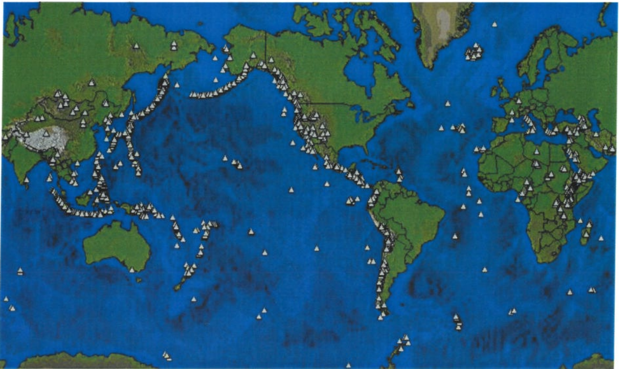
Figure 1 : Carte des volcans potentiellement actifs.

Mille cinq cents volcans sont potentiellement actifs sur Terre (voir figure 1). Un tiers d'entre eux ont été actifs dans les cent dernières années. Actuellement, 10% de la population mondiale vit dans des zones directement sous la menace des volcans potentiellement actifs.