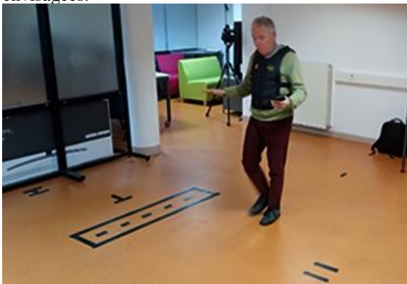
Figure 5 : Répétition au pedi-simulateur

Plusieurs modalités de test ou de simulation ont été envisagées.