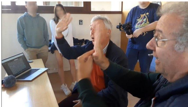
Figure 1 : Co-design de pictogrammes avec les pilotes HSI

des compléments... À quels stimuli les corps répondent-ils? Comment le langage du corps sera-t-il interprété par l'interlocuteur? Qu'est ce que la littérature nous dit à propos de ce qui se joue dans cette scène, dans cette "arène des habiletés techniques" ? [2][3]. Comment pouvons-nous questionner les attitudes des corps et les habiletés sensorielles forcément extra-ordinaires, pour des personnes en situation de handicap impliquées dans un processus de recherche action et de co-design technique?