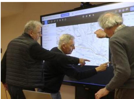
Figure 2 : Co-conception de scénarios à l'écran tactile

Cette phase correspond à l'ingénierie du protocole de vol qui servira ensuite à tester le dispositif selon un cas d'usage spécifique (tour de piste, entrée en zone de contrôle,