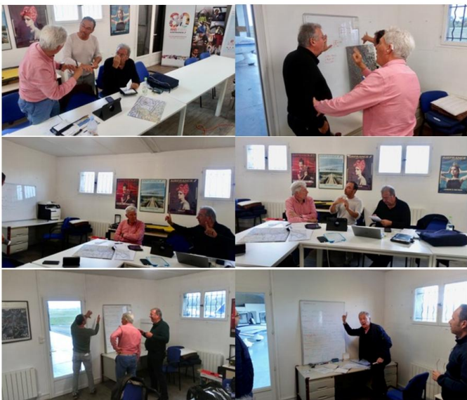
Figure 4 : Brief avec le pilote instructeur avant simulation

Le corps qui était sur le devant de la scène lors de la première phase se trouve ici travaillé par la situation pédagogique. Il devient récepteur d'injonctions à une attention renforcée à l'environnement de vol et aux règles, caractéristiques de la pratique de pilotage et de navigation.