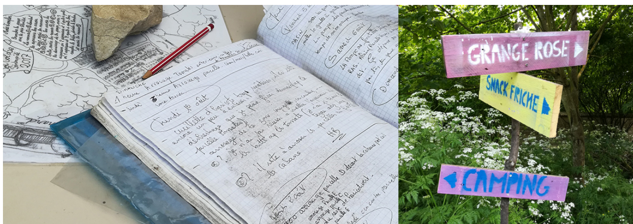
Fig.8 – Carnet d'organisation des travaux sur le Pot'Col – Panneaux de signalétiques des lieux-dits sur le terrain

L'organisation constante au sein du collectif nécessite la mise en place de nombreux outils d'information. Toute décision est le fruit d'une concertation en réunion ou d'un échange par courriel, la liste de diffusion « TierrayLibertad » créée au début du projet d'occupation est l'un des principaux outils de communication. Les échanges concernent tant l'organisation d'une session de plantation ou de récolte que celle d'une manifestation festive ou militante. Sur le jardin les « potagistes » communiquent via des agendas, tableaux, carnets laissés à disposition de tous dans l'abri qui contient les outils et les plants en godets. Sur le terrain la signalisation est assurée grâce à des panneaux de bois colorés avec des codes couleurs pour repérer les lieux-dits au sein du quartier libre ou les points phares du jardin.