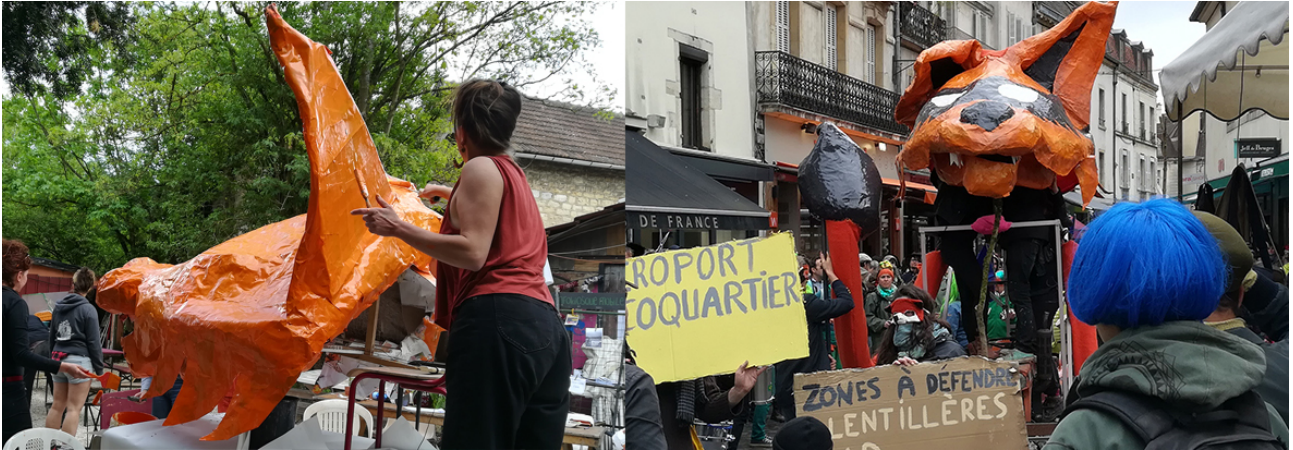
Fig.7 – Création du renard animé en vue de la manifestation du 28 avril 2018