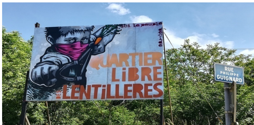
Fig.10 – Panneau sérigraphié face au rond-point à l'entrée du jardin