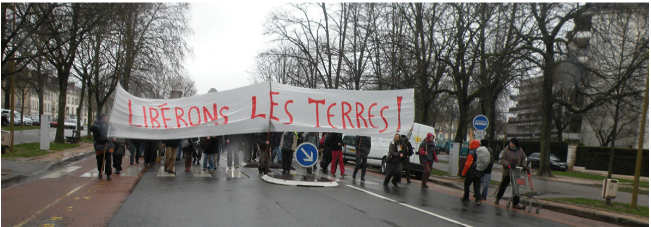
Fig.2 – Première manifestation pour l'occupation des terres maraichères, 28 mars 2010

Tout commence à Dijon au printemps 2010 avec la 3ème édition de la « semaine de l'environnement ». Cette manifestation annonce « être un modeste porte-voix des réflexions et expérimentations sociales et écologiques qui visent à la ré-appropriation de notre présent sans hypothéquer notre futur ».