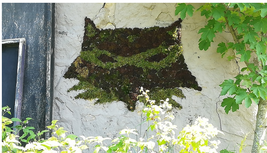
Fig.6 – Fresque végétale collective, Le renard est la mascotte du quartier libre

sérigraphié créé par un artiste local manifestant ainsi son soutien au quartier libre, identifiable il n'est cependant pas signé et a été érigé collectivement par les militants.