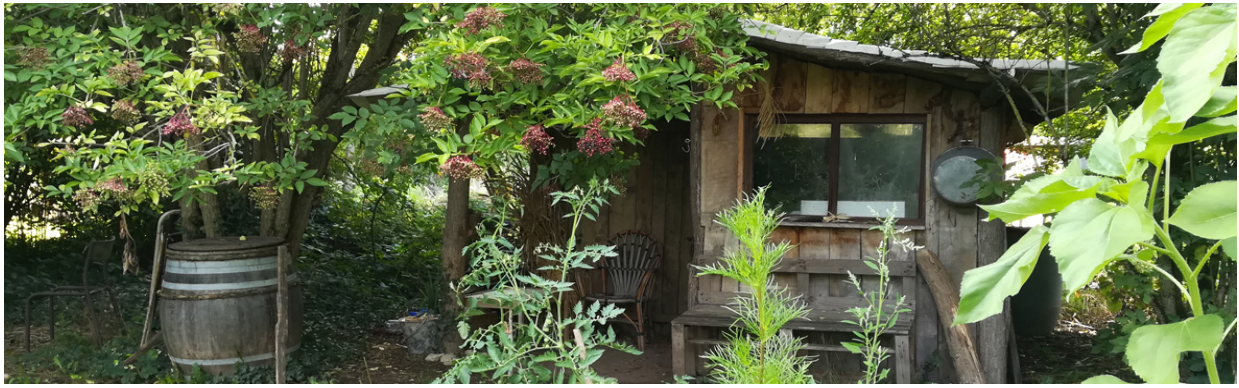
Fig.3 – Cabane - abri de jardin construit en matériau de récupération, bois et zinc

Entre 2010 et 2017 le terrain s'étend avec l'occupation progressive de parcelles individuelles. Au-delà des militants de la première heure et des migrants qui trouvent ici un refuge ce sont des gens du quartier, des résidents du foyer social voisin ou des citoyens en manque de nature qui viendront peu à peu occuper ces terres.