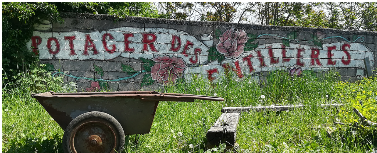
Fig.1- Fresque Potager des Lentillères au sein du jardin

Les ZAD, à l'origine « zones d'aménagement différé », ont été créées pour éviter « que des terrains nécessaires à la réalisation d'un projet d'aménagement public soient renchérissés lors de l'annonce de ce projet ». L'objectif de cette loi étant de réguler les prix afin d'éviter une spéculation sur les terrains à l'annonce d'un projet d'aménagement.