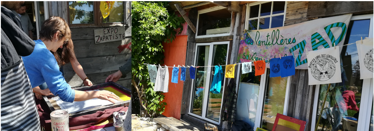
Fig.4 – Atelier de sérigraphie sur vêtements et fanions, 27 avril 2018

Le moindre espace sur ces terres est embelli, décoré. A chacune des entrées du jardin une œuvre en matérialise l'accès. Une mosaïque au sol, une pancarte d'assemblage, une affiche, une peinture, un graf, des fresques, sont autant d'œuvres créées collectivement. Ces créations peuvent être à l'initiative des occupants, envisagées sous la forme d'atelier participatif au moment des fêtes de résistance par exemple, ou spontanément produites par les jardiniers ou les habitants afin d'agrémenter leurs espaces.