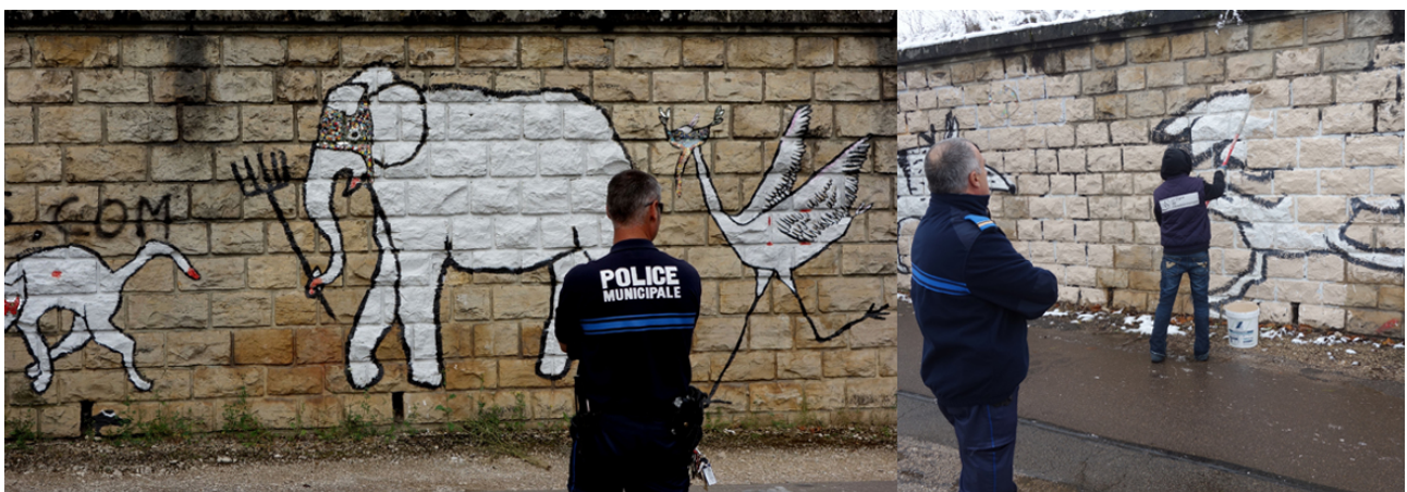
Fig.5 – Séance de nettoyage des peintures animalières le long de la voie ferrée

La nature, source d'inspiration inépuisable en art, est ici constante. Le monde végétal comme le monde animal règnent en maître dans les créations artistiques et décoratives au sein du quartier libre. Le long de la voie de chemin de fer qui côtoie le terrain le thème des animaux est omniprésent. Régulièrement effacés par les services municipaux, les murs ont vu se succéder renards, blaireaux, lapins, et autres animaux masqués qui font référence à la résistance sur le terrain.