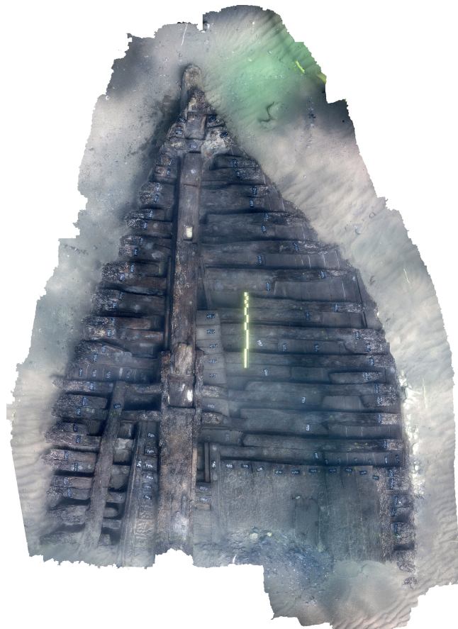
Fig.70. Orthomosaïque de la zone de l'étrave (cl. L. Roux, LA3M-CNRS-AMU, N. André architecte (IRAA-CNRS-AMU)

Ces observations permettent de constater que les données de terrain concordent avec la mise en perspective du dossier d'archives retrouvé cette année. L'ensemble correspond à un brick de deux mâts d'un tonnage de 154, 90 tonneaux comme mentionné dans l'acte de francisation daté du 23 mars 1849 réduit à 144,15 tonneaux après la pose d'un vaigrage complet, du payol et d'un faux tillac c'est-à-dire un pont démontable. Mentions qui se vérifient en observant l'épave. Dans le certificat de jauge les dimensions du navire sont de l'étrave à l'étambot de 22,51 m de long, 6,69 m de largeur au maître bau et 3,90 m de hauteur de la cale au pont. Après relevé de l'ensemble de l'épave, on peut en conclure que celle-ci n'est pas si