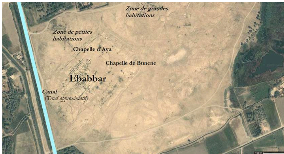
Fig. 2 : Plan de l'Ebabbar et de ses environs.

Photographie satellite avec modifications par l'auteur.