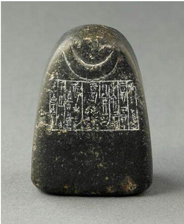
Fig. 3 : Poids inscrit d'une demi-mine, dédié à Šin par Šulgi.

Diorite. CA 2030 B.C., Tell-al-Muqayyar, ancienne Ur. Paris, musée du Louvre, AO 22187.