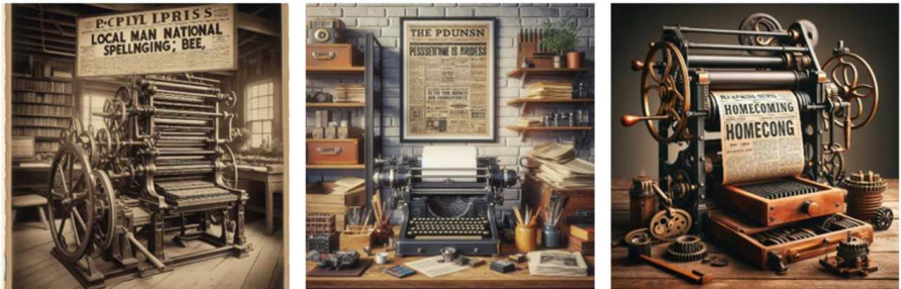
Figure 5. Une rhétorique du cadavre exquis

(figure 5), l'outil juxtapose les mots. Nul besoin n'est ici de passer par l'émotion pour observer qu'il ne produit pas une présentation, mais compose à partir de ses corpus, dans des mises en situation variées (un salon, un bureau, de très près). Les propositions, étonnantes, peuvent prêter à sourire par leur naïveté, mais aussi, fatiguer un utilisateur ayant une idée précise en tête, qu'il ne parviendrait pas à faire sortir en image à la machine. La scène est un cadavre exquis, superposant les termes du prompt , traduits au sens littéral dans une tentative de recontextualisation. Alors que, sur l'axe paradigmatique, il y a une concordance « à peu près » avec le texte en entrée, sur l'axe syntagmatique, les éléments sont réarrangés plus ou moins finement.