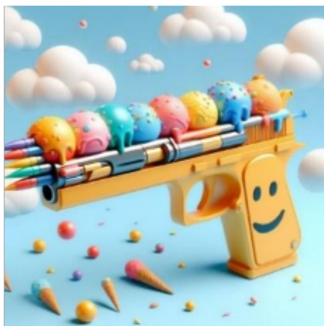
Figure 6. Une approche désubstantivée de l'émotion « Pistolet à glace et joie » (Dall-E, le 13/12/2023)

Les expérimentations ont, en effet, montré des signes des émotions vidées de leur contenu. Pour l'appréhender, intéressons-nous à un cas particulier, visuellement saisissant, mais sémantiquement incohérent. Pour comprendre l'opérativité des artefacts génératifs sur le signe, il convient, en effet, d'analyser très finement, au niveau de l'image elle-même, le devenir de l'émotion. Dans cette image (figure 6), la joie est signifiée par des signes qui renvoient à l'enfance. Un pistolet jaune occupe le centre de l'image, avec un smiley « 😊 » sur la crosse, proposant un visage heureux. Des boules de glace sont disposées le long du canon, qui semble, lui, envoyer des projectiles colorés aux formes de portemines. Le fond de l'image est composé de nuages blancs sur fond bleu, des cônes de glace et des boules jonchent le sol. Les formes arrondies, les couleurs brillantes et vives, créent une atmosphère de fête, voire de fête foraine. On peut supposer que, dans les corpus de données, la joie est associée à des termes comme sourire, couleur, enfance. Le pistolet à glace, objet sans référent réel, est composé à partir d'un vrai pistolet.