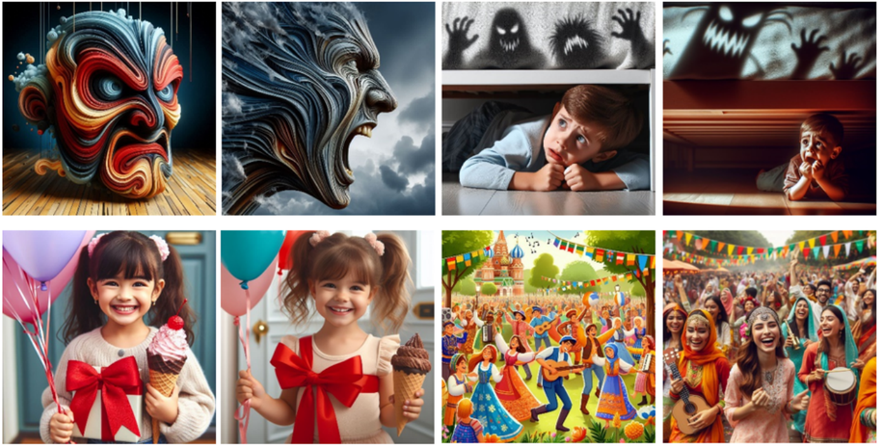
Figure 1. Des représentations stéréotypées d'affects De gauche à droite et de haut en bas : « Anger », « Fear », « An other representation of surprise », « Joy » (Dall-3, le 27/05/2024)

Les artefacts génératifs effectuent, pour commencer, un usage stéréotypé des formes visuelles. Dans les images en sortie, chaque émotion est associée à une coloration (le noir pour la tristesse, le rouge pour la colère, des couleurs vives pour la surprise, chaudes pour la joie) (figure 1). Certains préjugés sociaux sont reconnaissables : les genres ne partagent pas les passions (la tristesse serait plutôt féminine, la colère masculine), il y aurait un âge pour la surprise et la peur (l'enfance), un pour la tristesse (l'adolescence) et un dernier pour la colère (l'âge adulte). Les propositions affectives sont endossées par des objets convenus (des déchets pour le dégoût, un gâteau pour la surprise, des fleurs ou des instruments de musique pour la joie) ; des situations, des êtres vivants ou allégoriques (un monstre pour la peur). La tristesse est, par exemple, incarnée par des filles minces, jeunes, assises sur un banc, sous la pluie. Enfin, vivants et non vivants sont émotionnellement chargés : un taureau ou un chat peuvent éprouver de la colère ou du mépris selon des lieux communs humains (un sourire, un rictus, des yeux expressifs), et un vase ou un pistolet transmettent, au sens littéral, de la tristesse ou de la joie. Selon les dispositifs, les configurations et les références varient, mais, globalement, peu de choses diffèrent.