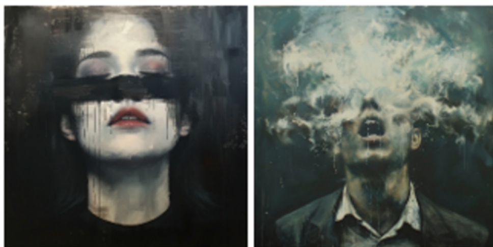
Figure 2. L'émotion, une construction algorithmique basée sur des corrélations de données

Sur le plan technique, les IAs génératives utilisent des réseaux neuronaux artificiels (RNA) (Moyse, 2023). De ce fait, l'émotion doit se définir comme une construction algorithmique basée sur des corrélations de données, plutôt que sur une représentation intrinsèque, ou intuitive, du corps. Ces réseaux neuronaux traitent des millions d'images et de descriptions pour créer des représentations visuelles, amalgamant divers éléments associés à l'émotion, selon les tendances observées dans leurs ensembles d'entraînement. Cela engendre des représentations parfois incohérentes, ou éloignées de l'expérience humaine directe des affects, soulignant la compréhension sensible limitée des IA génératives. Ainsi, si un visage livide, yeux fermés ou cachés par une épaisse fumée, apparaît pour le « dégoût » dans Midjourney (figure 2), c'est que, dans ses corpus, ces termes lui sont accolés. C'est moins « le dégoût » que l'agglomération de motifs associés, plus et moins directement. La composition reflète, ainsi, ce qui leur est le plus souvent associé dans leurs bases, comme un miroir partiel des corpus de données.