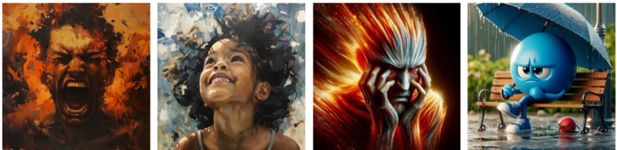
Figure 3. Le visage comme siège de l'émotion

Cette classification est problématique en ce qu'elle opère une simplification de la multiplicité et des nuances des émotions, réduisant leur étendue (Lardellier, 2017) et leur complexité à sept catégories. Elle impose une « compréhension mécaniste et réductrice [...] en négligeant les autres dimensions extéroceptives ou intéroceptives des affects » (Henke, 2021 : 69). Par exemple, les présentations ignorent que la tristesse et la colère peuvent être vécues simultanément. Ou encore, que la joie n'est pas toujours synonyme de fête ou de rêve éveillé. Ajoutons que la peur peut être ressentie en plein jour. Surtout, une passion ne saurait être uniquement définie par un visage (figure 3), ce que la majorité des images certifie pourtant. De même, au moment de traduire notre prompt en anglais, Dall-E ajoute la mention d'un visage, qui plus est, joyeux : « des personnes en colère face à des fleurs » : « angry people with happy faces and flowers » (5/07/2024). Cette approche sert des visées stratégiques de compréhension, de gestion et de travail des affects. Elle n'a d'universel que le nom : il n'y a, en effet, pas d'universalité des émotions, ni de leur expression (Corbin et al., 2016).