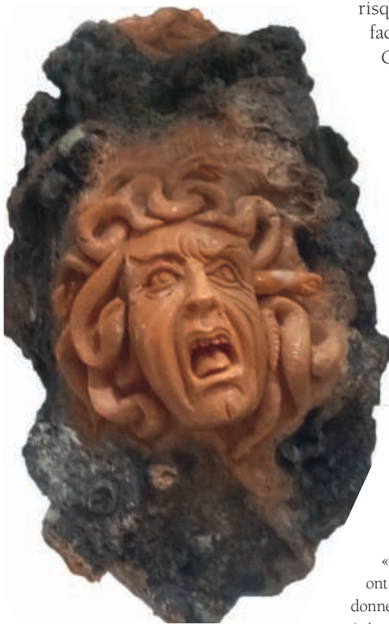
5. Tête de Méduse en corail (Ajaccio, Corse) Vitrine de la bijouterie La boutique du corailleur

la réciprocité du voir et de l'être-vu sont les thèmes centraux de la dramaturgie méduséenne (Vernant 1985 : 77). L'épreuve qu'impose le roi Polydectès à Persée consiste à triompher d'un interdit visuel : s'emparer de ce dont le regard donne la mort. Il s'agit d'œuvrer sans regarder et sans être aperçu. Condition qui inverse l'équivalence entre vivre et voir, car devant Méduse voir et être vu signifie mourir 6 .