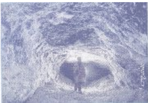
Figure 4 - Réseau du Nébélé, galerie des Spirales aux parois recouvertes de gypse.