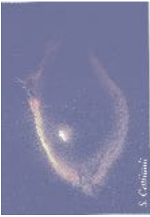
Photographie de la figure 2 : le puits des Pirates, 350 m de verticalité absolue, est le plus grand puits souterrains de France. Il recoupe à la faveur d'une faille majeure les calcaires marneux alpins et les calcaires urgo-aptiens.